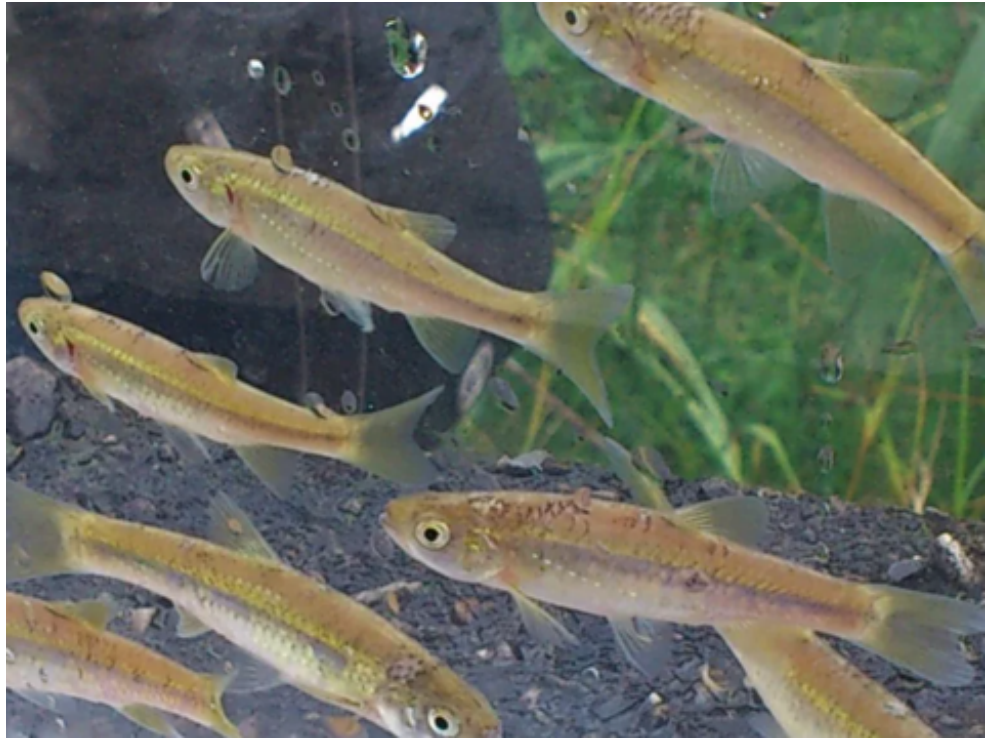
圖3 臺灣白魚示意圖