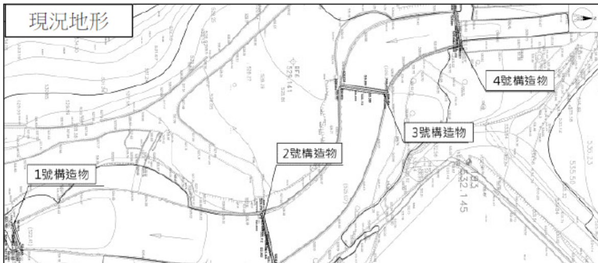
圖1 4座攔砂壩位置圖

(一)埔里農莊於剗牛坑溪上游逕自建造4座攔砂壩，據南投縣政府指出，該4座攔砂壩於111年8~9月期間施設完成，南投縣議會副議長於113年2月6日邀集南投縣政府相關單位至現場勘查，始發現該處野溪上游存有此4座攔砂壩，相關位置如下圖。