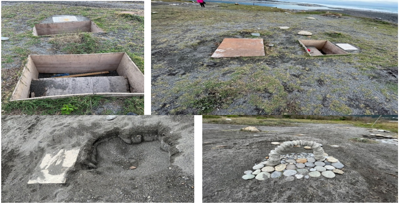
照片3 順安三棧海灘之人工設施物 隨處可見業者獨占性使用設置物品及用來固定設施之水泥，嚴重破壞地貌與地景。