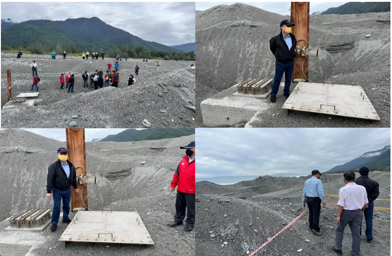
照片6 本案調查委員發現新城鄉未登錄海岸土地遭開挖鋪水泥及取用深層海水，目前暫以黃色警示線圈圍起來。

以砂土掩蓋挖掘坑洞，未完全騰空及恢復原狀，且有管線突出地面，民眾至沙灘遊憩，恐有公共安全之虞 13 ，顯見主管機關疏於監督且整體作為不足，有檢討及改進之必要。又針對此個案係國產署與東潤公司訂有合法使用契約、花蓮縣政府同意佈管及內政部准予修繕管線，權責劃分下地方政府無稽核機制，致發生個案違法開挖，中央監督困難，地方政府不知情等情，難以究責，為防止未來類此個案發生，在監督機制上未來可增加備查的動作外，行政院允應督促所屬澈底檢討並研議配套措施，俾利所屬遵循。