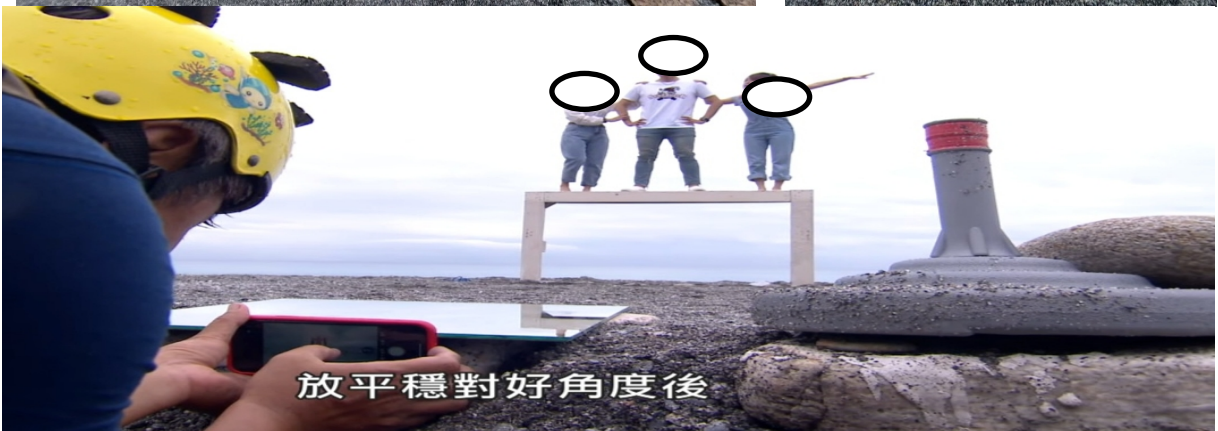
照片4 本院諮詢學者所提供三棧溪出海口沙灘拍攝裝置藝術照之設施