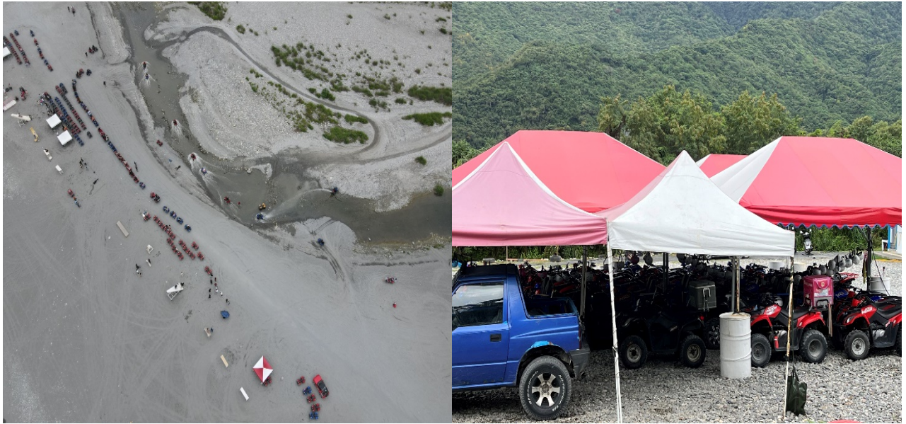
照片5 (左圖) 本院諮詢學者所提供三棧溪出海口空拍圖、(右圖) 本院履勘時所拍攝業者停放沙灘車處所 (111.12.30 拍攝)

(五)據上論結，花蓮縣境沙灘車活動區域範圍，以花蓮溪出海口為界，轄管範圍不同，以南為東管處，以北則為縣府，登記有案從事沙灘車活動業者約20家，本院實地履勘時發現，部分業者承租範圍與活動範圍不一致，且活動範圍涉生態保護用地、未登錄地，甚隨處可見沙灘上仍有非法設置人工設施物，期間屢接獲陳情未見改善，嚴重破壞美麗海岸線，造成有礙觀瞻、凌亂不堪。另查例行巡查與聯合稽查紀錄，出現連續性之缺失，包含未訂定緊急救護救援計畫、未提供出廠證明、未於營業場所揭示商業登記證、騎乘範圍無標示等，均涉人身安全相關規範，甚相同缺失依然發生，迄未積極解決，難辭監督不力之咎。是以，對於整體沙灘車的管理，及獨占性設置人工設施物，均應積極檢討改進，並嚴加巡查與稽查，避免重覆發生，以確保近岸海域及沙灘等公共財不淪為業者之私有財供其營業使用。