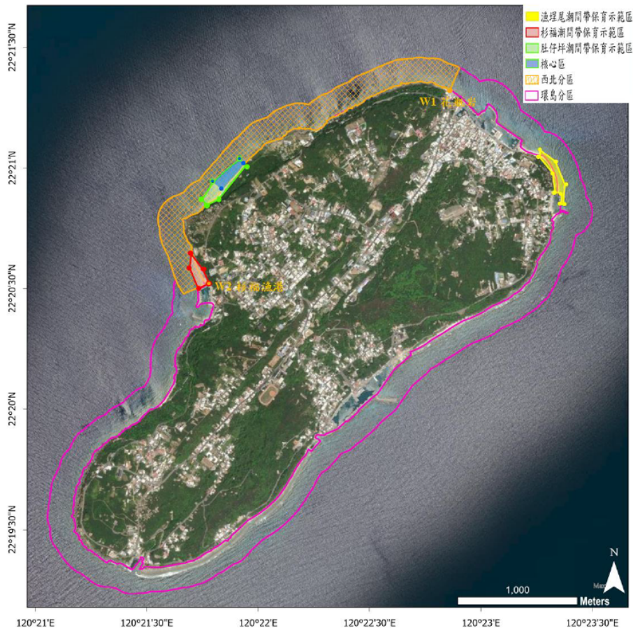
圖3 琉球水產動植物繁殖保育區位置圖

(六)綜上，屏東縣政府對於小琉球島上熱門潮間帶及自然人文生態景觀區無法完全落實遊客總量管制，造成小琉球海域海洋生態沉重負擔；又長期忽視該島海域珊瑚覆蓋率衰退及生態惡化狀況，遲至113年始將珊瑚列入該縣「水產動植物繁殖保育區」之保育對象，屏東縣政府實有檢討改進之必要。