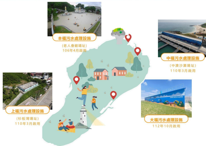
圖4 小琉球污水處理設施位置圖

(七)小琉球沿海之珊瑚礁覆蓋率係全臺最低，其中杉福潮間帶5公尺處海域之珊瑚覆蓋率由110年14.2%降至112年的5.7%，珊瑚覆蓋率已低於1成。而杉福潮間帶鄰近之上福村聚落式污水處理設施係於110年啟用，近年報告亦顯示杉福潮間帶水體呈優養化現象，且海域受人為營養鹽輸入影響嚴重，均揭示珊瑚礁生態系惡化確與人為用水排放及營養鹽污染具密切關連。綜上，海委會雖定有「海域環境分類及海洋環境品質標準」，然珊瑚礁生態系對於水體中營養鹽含量變化較為敏感，海委會卻未據以研擬更嚴謹、適切之規定，相比鄰近亞洲國家之海域環境保護規範與力度，我國仍有不足。又小琉球島上雖已設立4座污水處理設施，然污水處理對於營養鹽去除效果有限，小琉球多處潮間帶仍有藻類繁生等優養化現象，致使珊瑚礁生態系持續惡化，珊瑚覆蓋率僅剩約1成，海委會及屏東縣政府均有檢討改進必要。