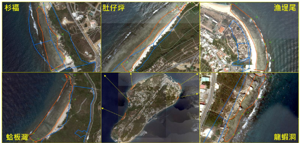
圖2 小琉球自然人文生態景觀區位置圖

(二)海委會前於110年補助屏東縣政府建置「潮琉生態保育網」，強化潮間帶人數管制及提供遊客預約系統以縮短等待時間等便民措施，網路平台並提供潮間帶生態物種圖鑑資料庫，強化生態教育與保育管理知識。又該會另於111年度補助辦理「屏東縣琉球鄉自然人文生態景觀區承載量評估及線上預約制度推動計畫」，評估小琉球5處自然人文生態景觀區潮間帶承載人數，評估結果為漁埕尾230人、杉福306人、肚仔坪264人、蛤板灣258人及龍蝦洞50