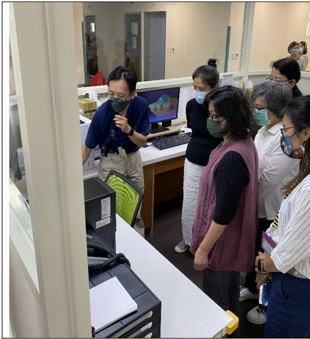
圖12：調查委員實地履勘。