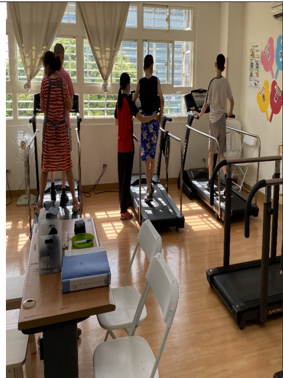
圖9：身障個案復健情形。