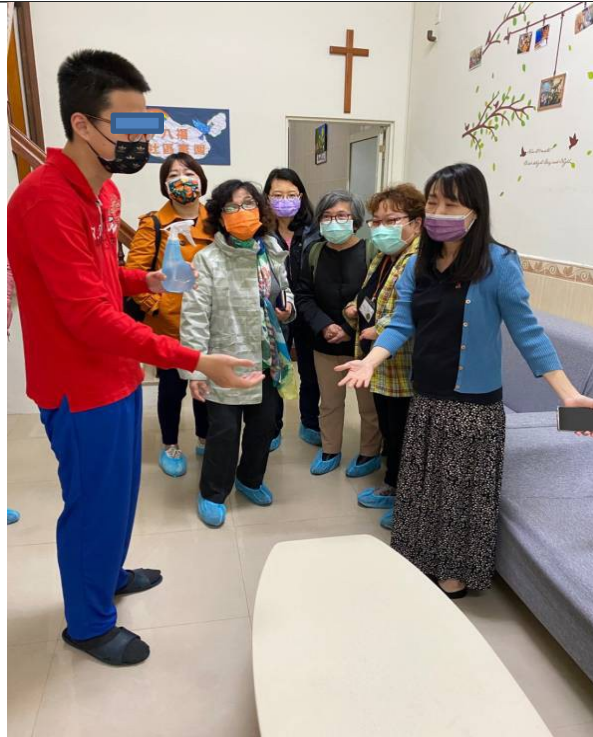
圖2：調查委員履勘高雄市情緒行為支持中心。