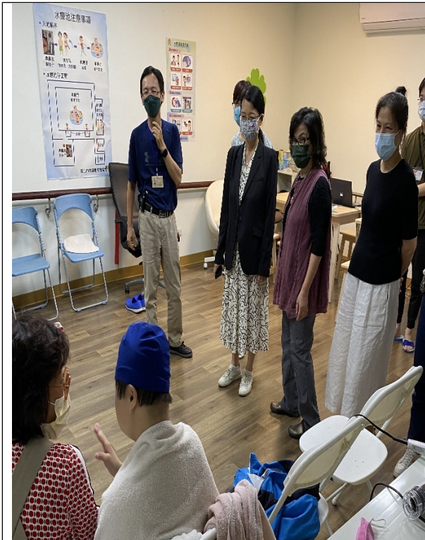
圖8：調查委員實地履勘身障個案水療情形。