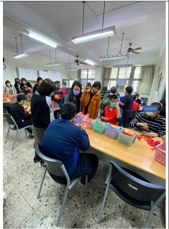
圖5：八福社區家園個案住宿空間。