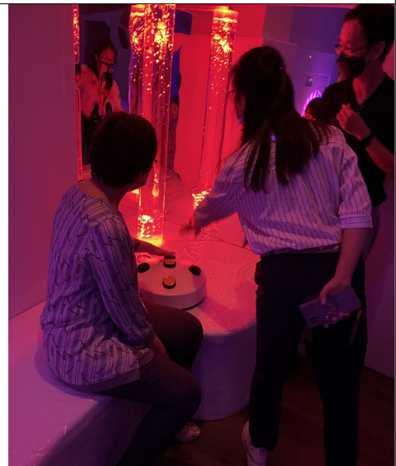
圖11：調查委員實地履勘個案感官體驗。