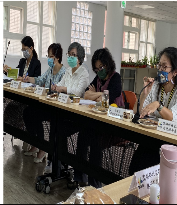
圖13：調查委員實地履勘並與機關人員座談。