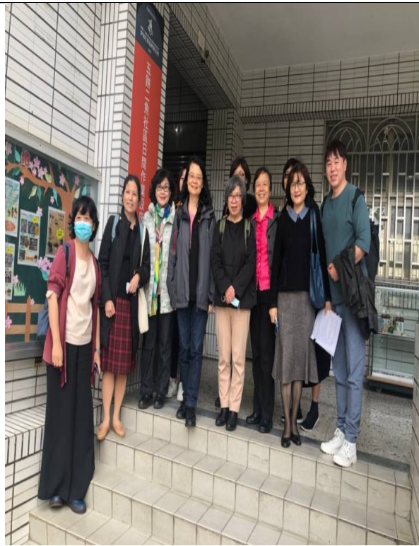
圖4：八福社區家園個案介紹住宿環境予調查委員。