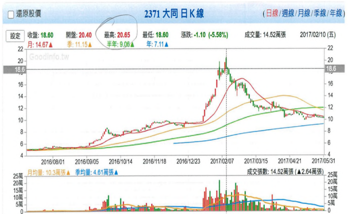
附圖三、106年2月10日波段最高點20.65元