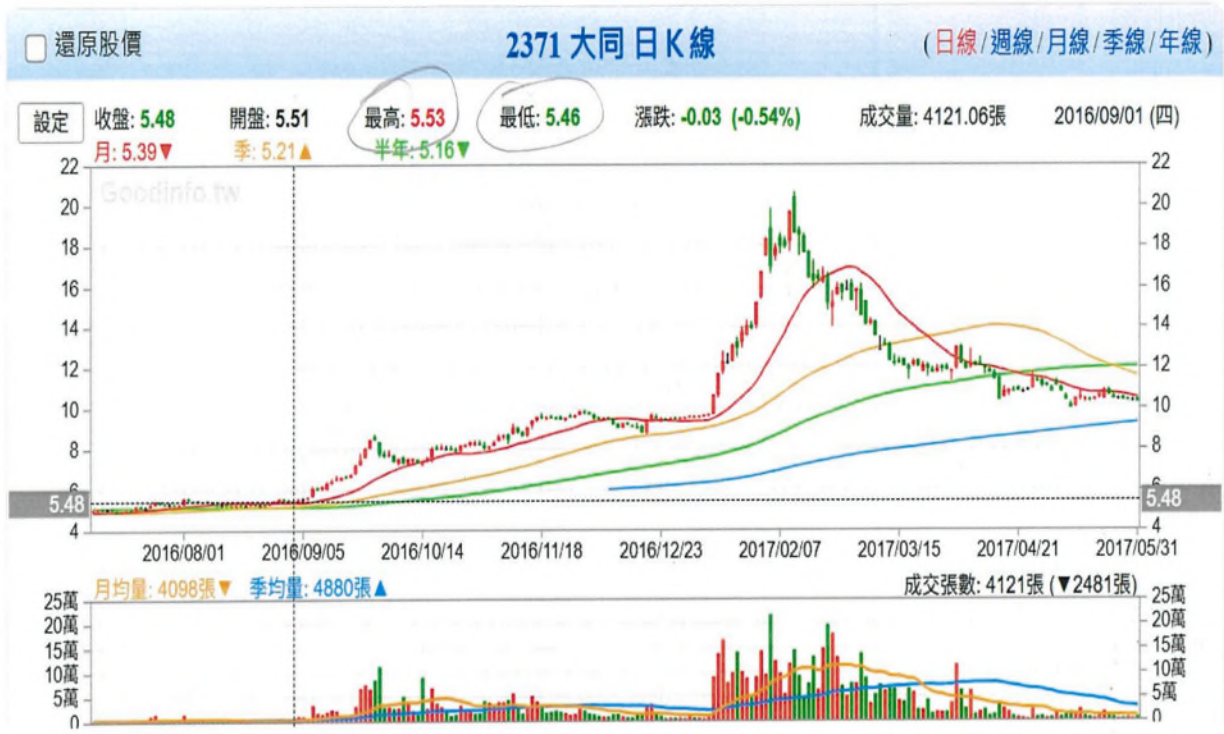
附圖一、105年9月1日是起訴操縱期間起點