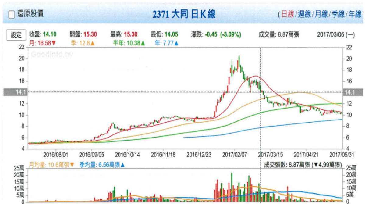
附圖四、106年3月6日起訴操縱期間末日