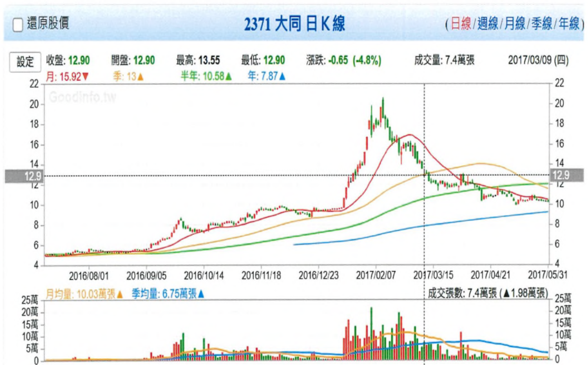
附圖五、106年3月9日股東會最後買股日