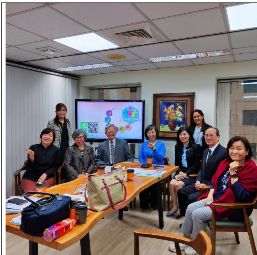
照片4-委員與善意溝通協會成員合影。