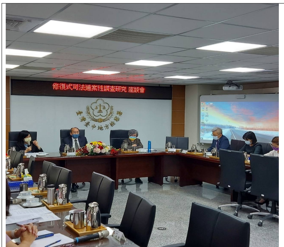
照片3-委員於聽取臺中地檢署簡報後舉行座談。