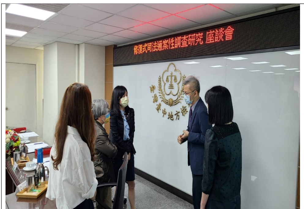
照片5-委員於座談會後進一步與黃嘉生主任檢察官意見交流。