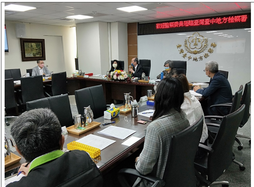
照片4-委員於聽取臺中地檢署簡報後舉行座談。