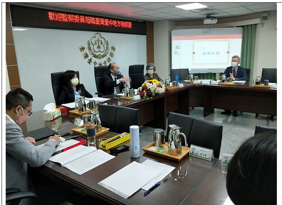
照片2-委員於聽取臺中地檢署簡報後舉行座談。