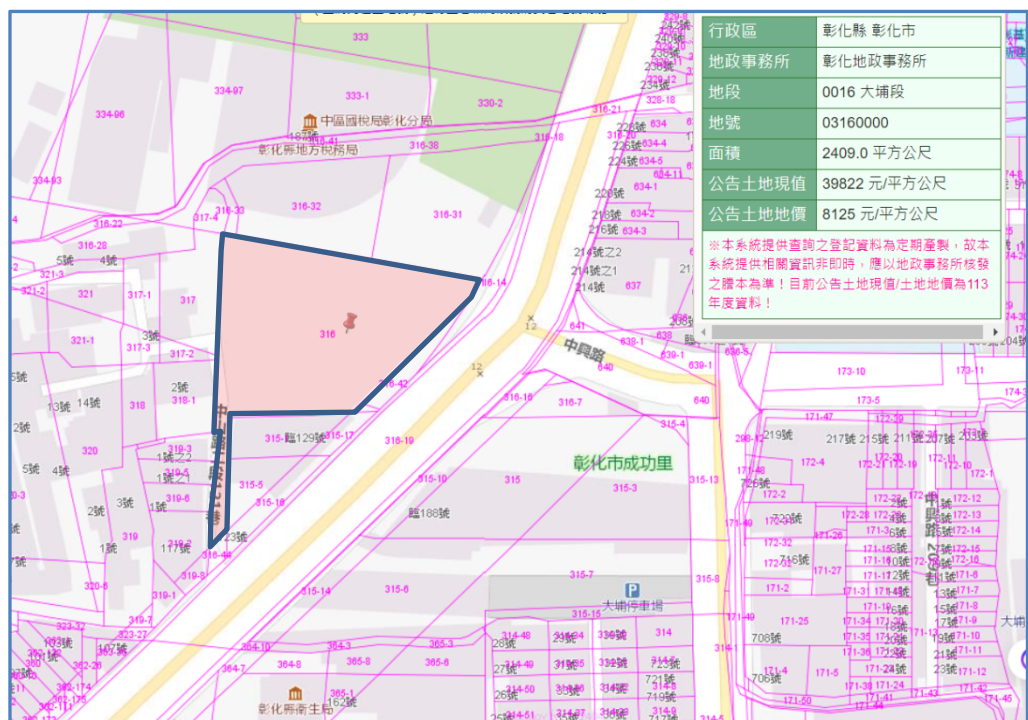
圖2 彰化執行分署經營彰化縣彰化市大埔段316地號地籍圖