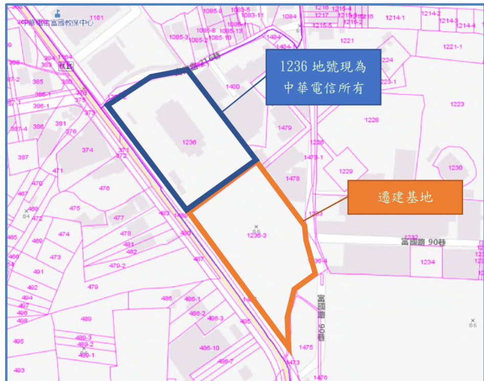
圖4 桃園執行分署遷建基地範圍示意圖

(二)依法務部說明，桃園執行分署自97年11月19日撥用取得後，98年間即多次提報辦公廳舍自有化中長程計畫報告書，並依據上級機關歷次審核意見修正報告書及重新檢視需求，以尋求最適當之規劃方案。惟99年間因進行法務部行政執行署臺中、新竹、彰化行政執行處辦公廳舍自有化計畫訂定統一面積案，法務部函請桃園執行分署將中長程計畫報告書併入該案檢討辦理，再行報核。嗣後，桃園執行分署101年間陳報中程計畫書，法務部102年審查意見則建議俟「法務部行政執行機關辦公室面積需求設置基準表」(草案)奉行政院核定後再據以辦理。而因設置基準表於104年始經行政院核定，桃園執行分署爰自104年重新提報評估報告，至105年-109年間每年均提報評估報告，卻多因基地容積未充分利用，遭法務部一再退請修正，直至111年4月間再度陳報，終經轉陳行政院及依行政院核復意見修正