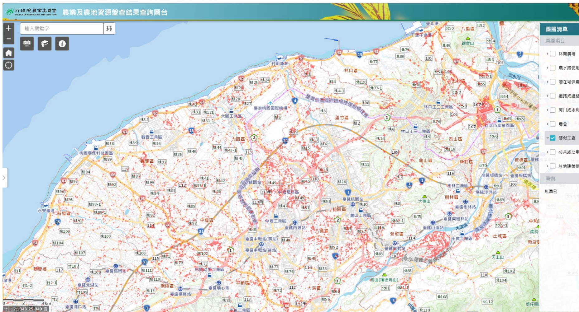
截自農委會「農業及農地資源盤查結果查詢圖台」-新北市及桃園市範圍(110年10月18日) 註：紅色標示即為「疑似工廠」。