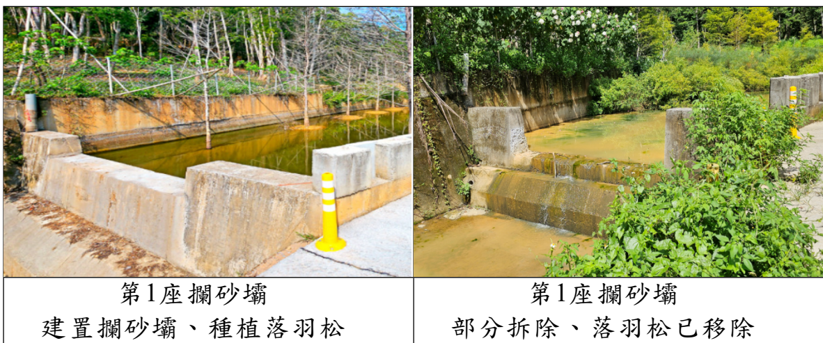
照片1 第1座攔砂壩照片