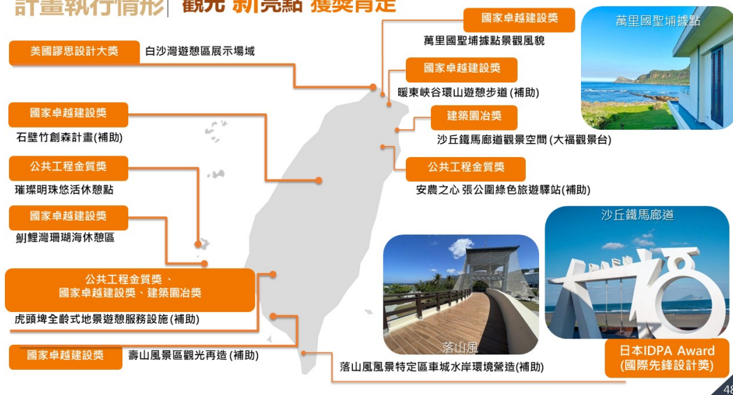
圖2 觀光前瞻建設計畫補助個案獲獎情形-2