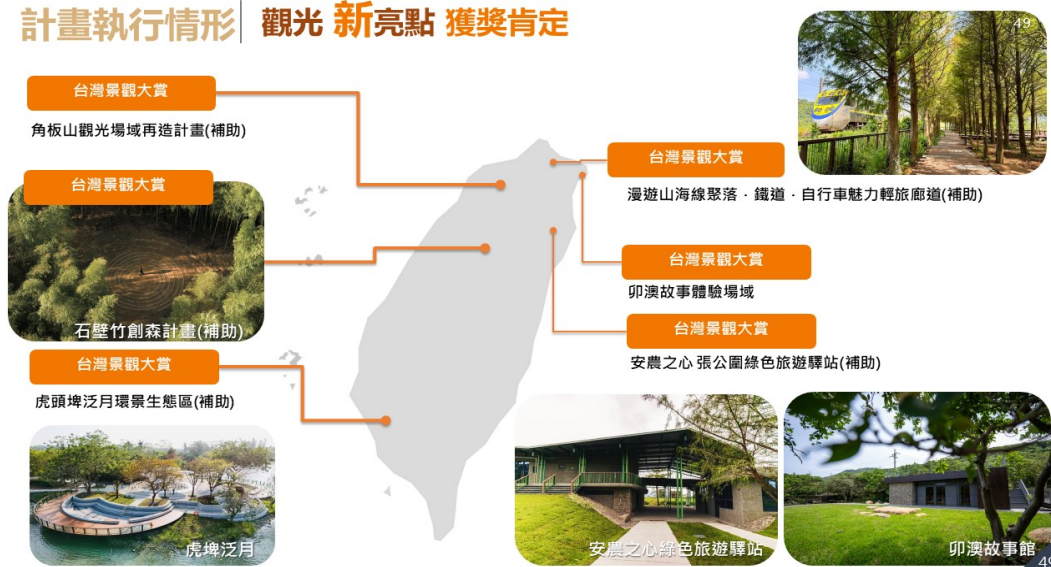
圖1 觀光前瞻建設計畫補助個案獲獎情形-1