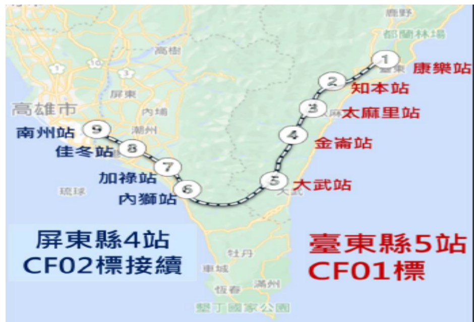
圖3 南迴車站計畫範圍示意圖