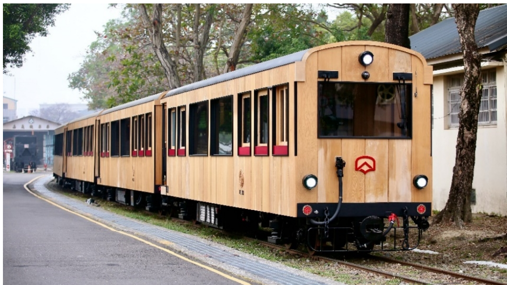
圖2 福森號列車外觀