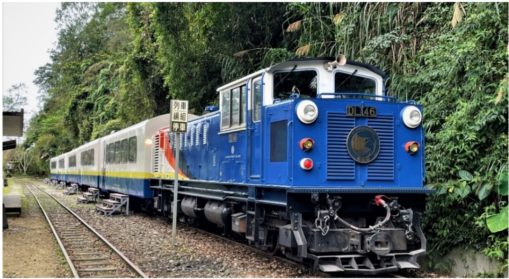
圖1 栩悅號列車外觀