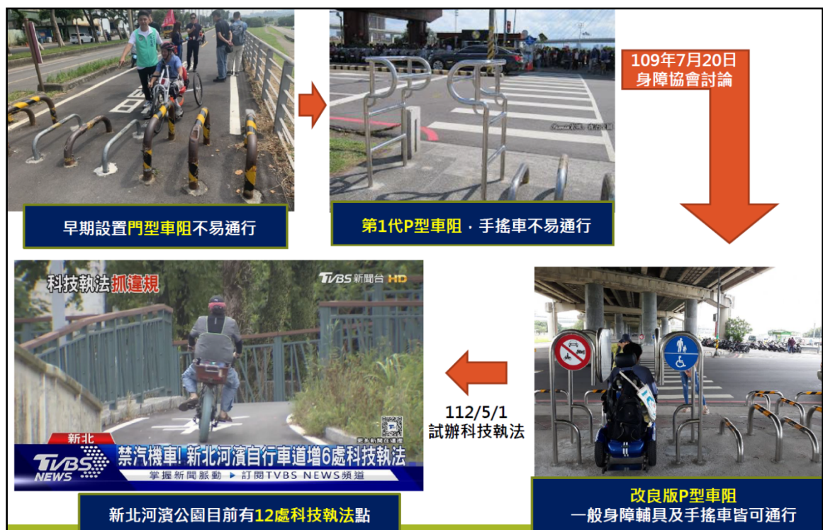
圖2 高灘處改善車阻情形