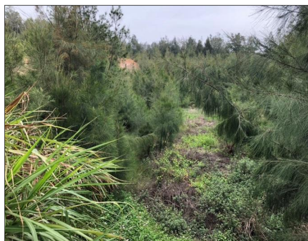
滯洪池內雜草樹木叢生