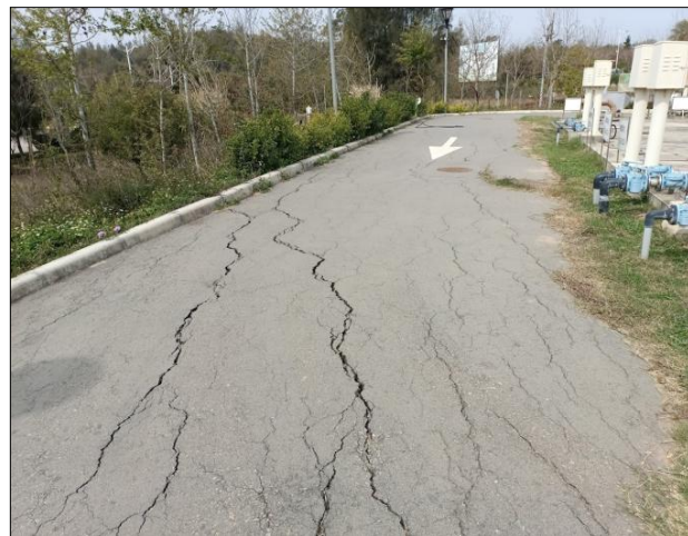
廠區道路路面龜裂下陷情形