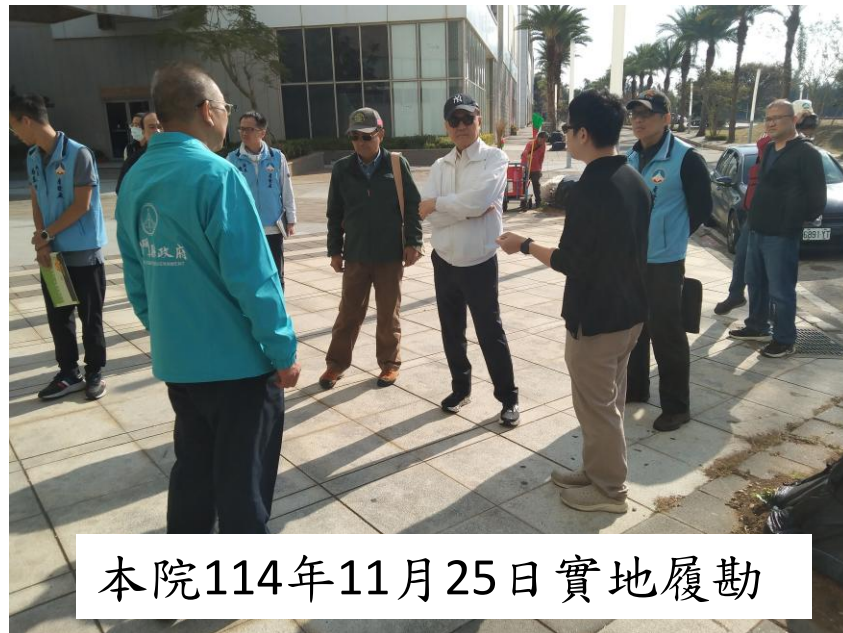
本院114年11月25日實地履勘