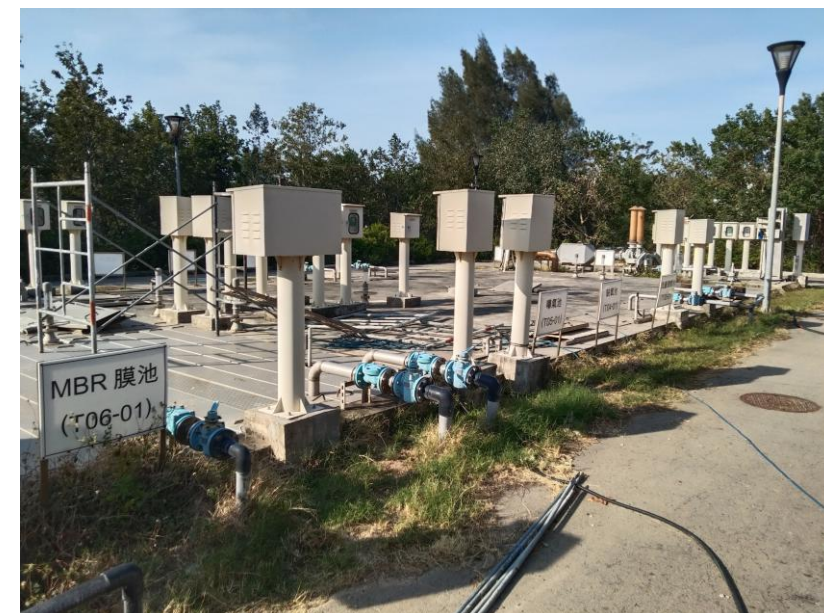
污水處理廠之進水量不足