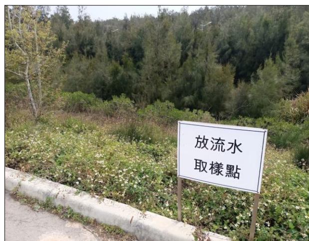
滯洪池內雜草樹木叢生