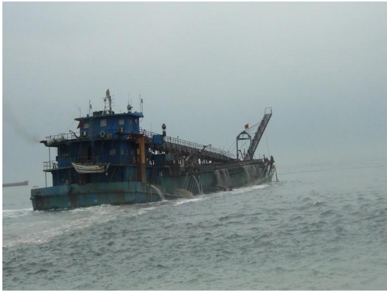
108年5月22日取締海盛655全船照