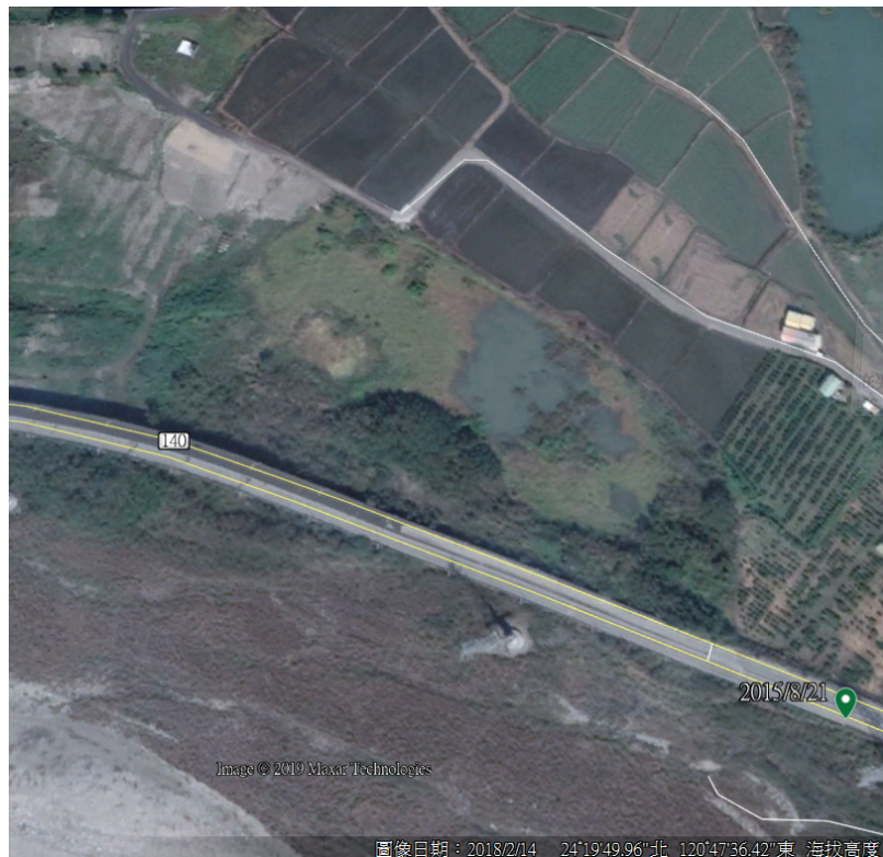
照片1 【本案基地107年2月14日空照圖-尚未整地】