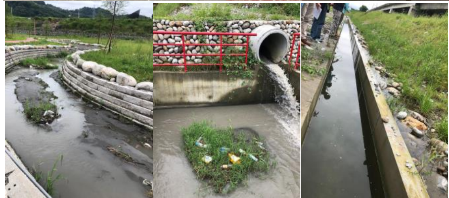
▲以上為本院108年5月29日履勘拍攝實景