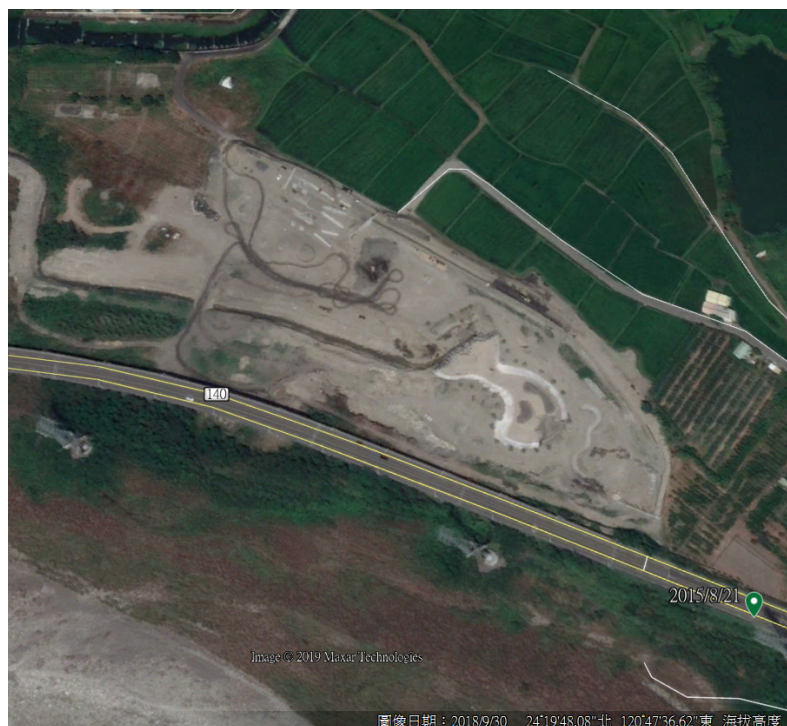
照片2 【本案基地107年9月30日空照圖-已整地】