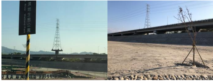
▲以上為本院 108 年 1 月 24 日履勘拍攝實景