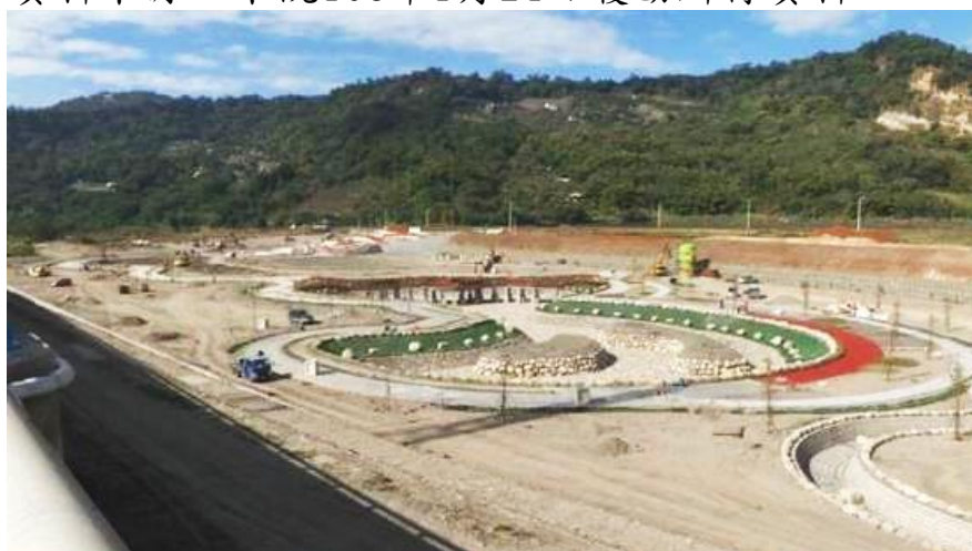
照片2 【本案基地施工情形】