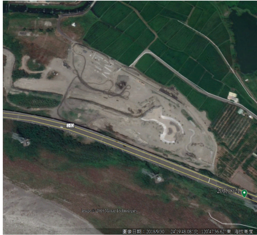
照片4 【本案基地107年9月30日空照圖-已整地】