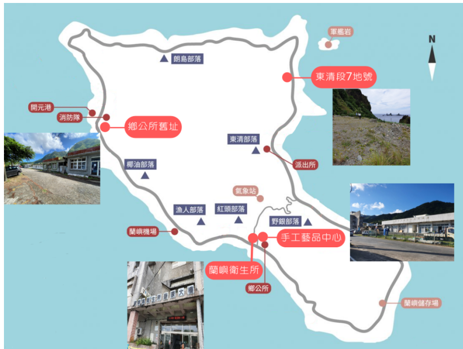
圖1 蘭嶼分院設立位址選項圖