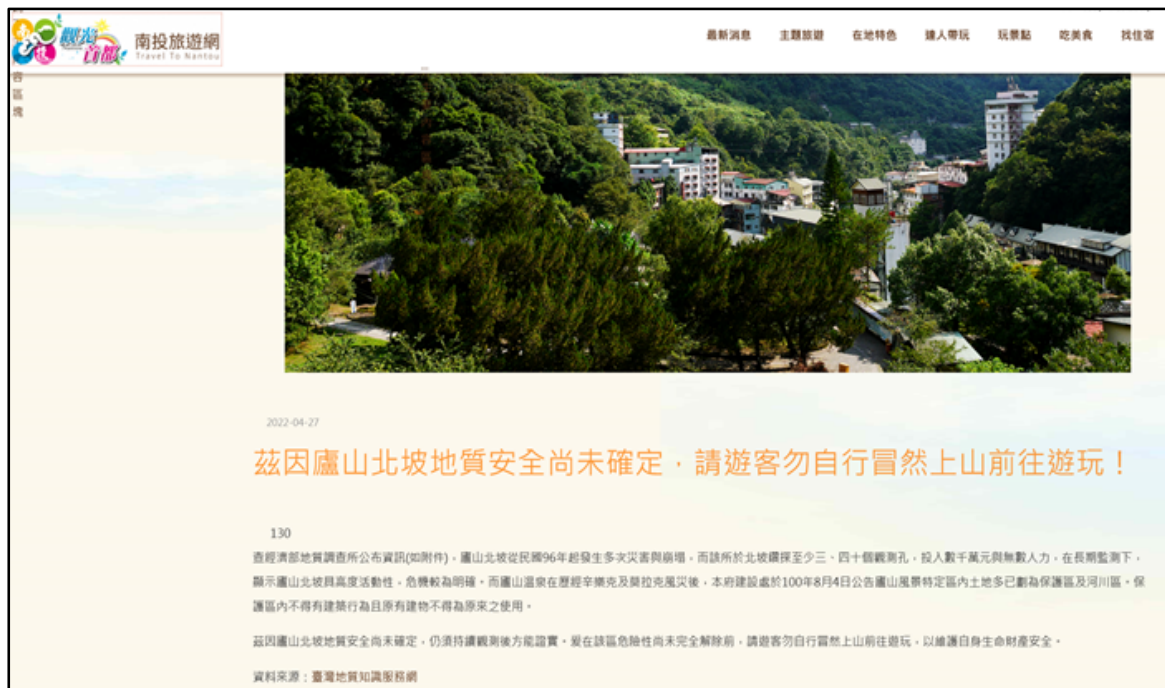
附圖 4、南投縣政府於 111 年 4 月 27 日在南投旅遊網公告之警示