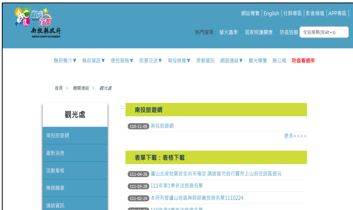
附圖 3、南投縣政府於 111 年 4 月 26 日在該府網站公告之警示