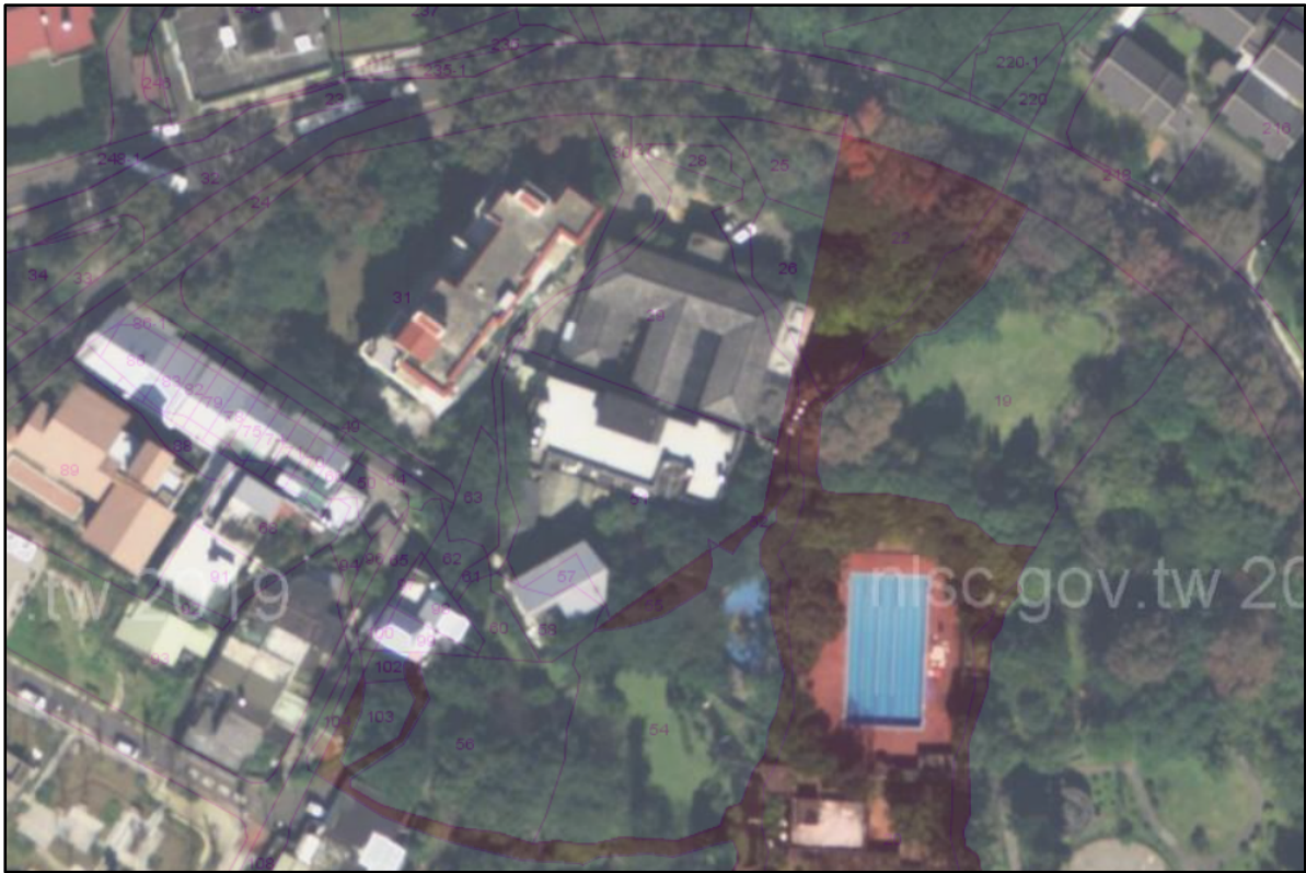
圖2 國際大旅館占用土地航照圖