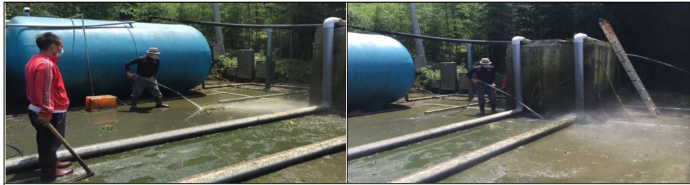
A區處理槽：族人用水刀清理從進水池滿溢出來的污水。因為產生惡臭，白天風往上吹，惡臭味直接吹向上方的學校，造成學校環境嚴重困擾，族人平均每月2-3次重複清理的工作。

現勘發現，廢(污)水並未進入污水處理系統而直接排放，該設備雖仍定時運轉，惟形同空轉，未發揮設置目的，迄105年12月9日該局考量該設備已無法有效處理廢(污)水而關閉電源，肇致設備閒置。