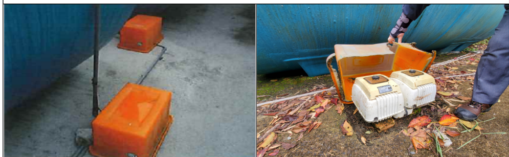
司馬庫斯部落族人反應夜間鼓風機馬達噪音過大，影響生活，經