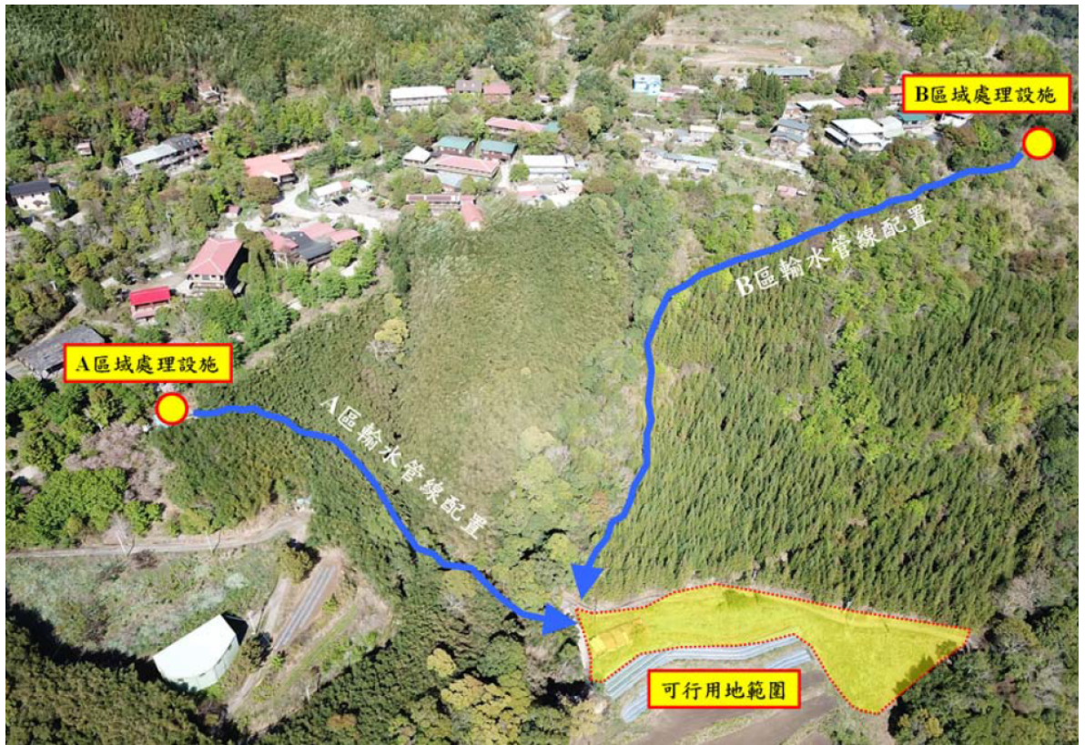
圖A 未來A、B區集水管線配置圖

(三)原示範工程於98年委託規劃設計時，因當時的設計容量係以現況每天110噸的處理量進行規劃，未考量到司馬庫斯部落未來遊客數量的成長性，再加上前揭完工後未確實維護操作之相關缺失，導致原示範工程驗收後半年內即產生問題。本院調閱司馬庫斯部落98年至109年之人口數及遊客數，如表A及表B，可以看出109年部落人口數211人為98年116人的1.8倍，以及109年的遊客數14萬7,989人為98年4萬3,027人的3.4倍，均有顯著成長。