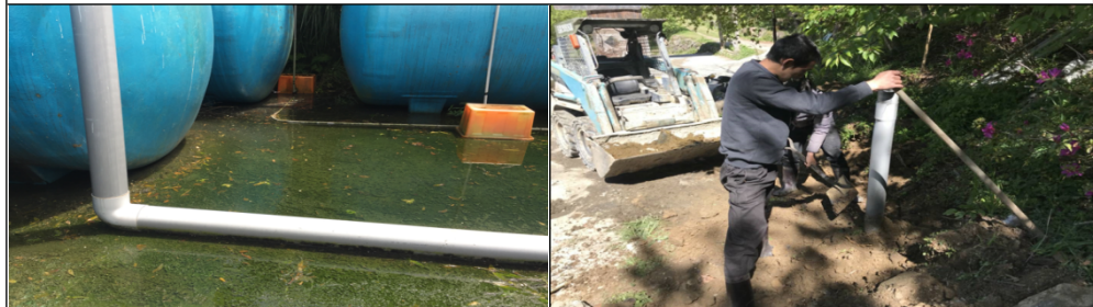
A區處理槽：進水井、藍色的污水處理槽，不斷的溢出來污水，污水就積在水泥地上。為期改善惡臭問題，族人增設排氣孔，希望連到各家戶、民宿的臭味可以減緩，惟執行成效有限。