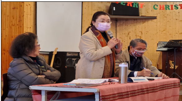
機關簡報後召開座談會議