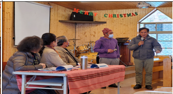
請司馬庫斯部落代表說明