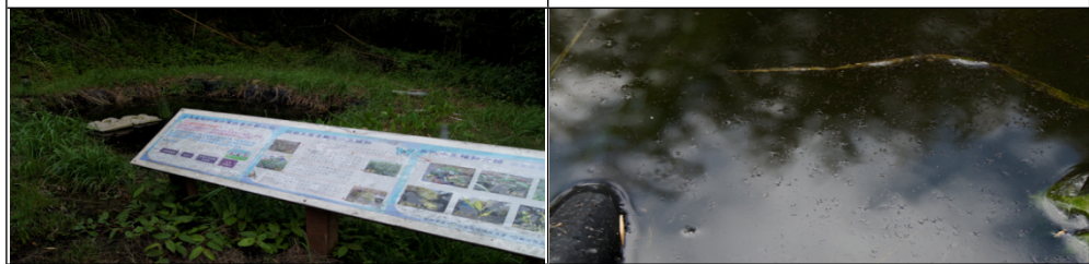
B區污水處理區：從處理槽出來而進入生態池的水，無法達到淨化目的，造成生態池臭味、蚊蟲滋生問題日益嚴重。