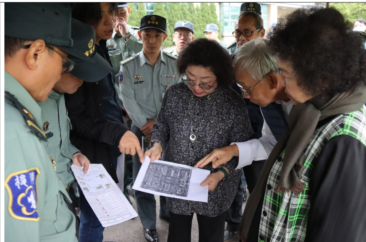
原臺灣省生產教育實驗所（新北市土城區，審定不義遺址） 范委員與當年交付感化之當事人比對現況遺址1