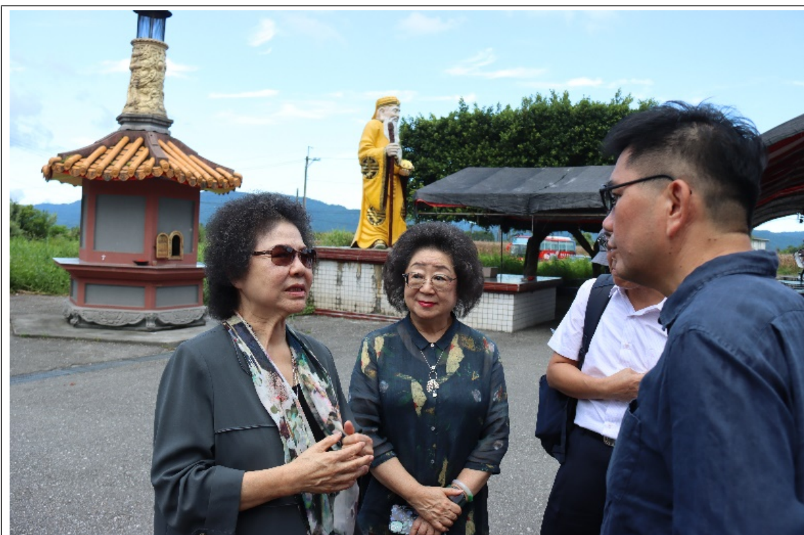
二二八事件不義遺址（花蓮鳳林公墓；張七郎槍殺地點）