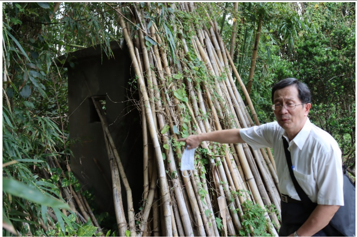
家屬指出徐厝側門外的崗哨亭構造物