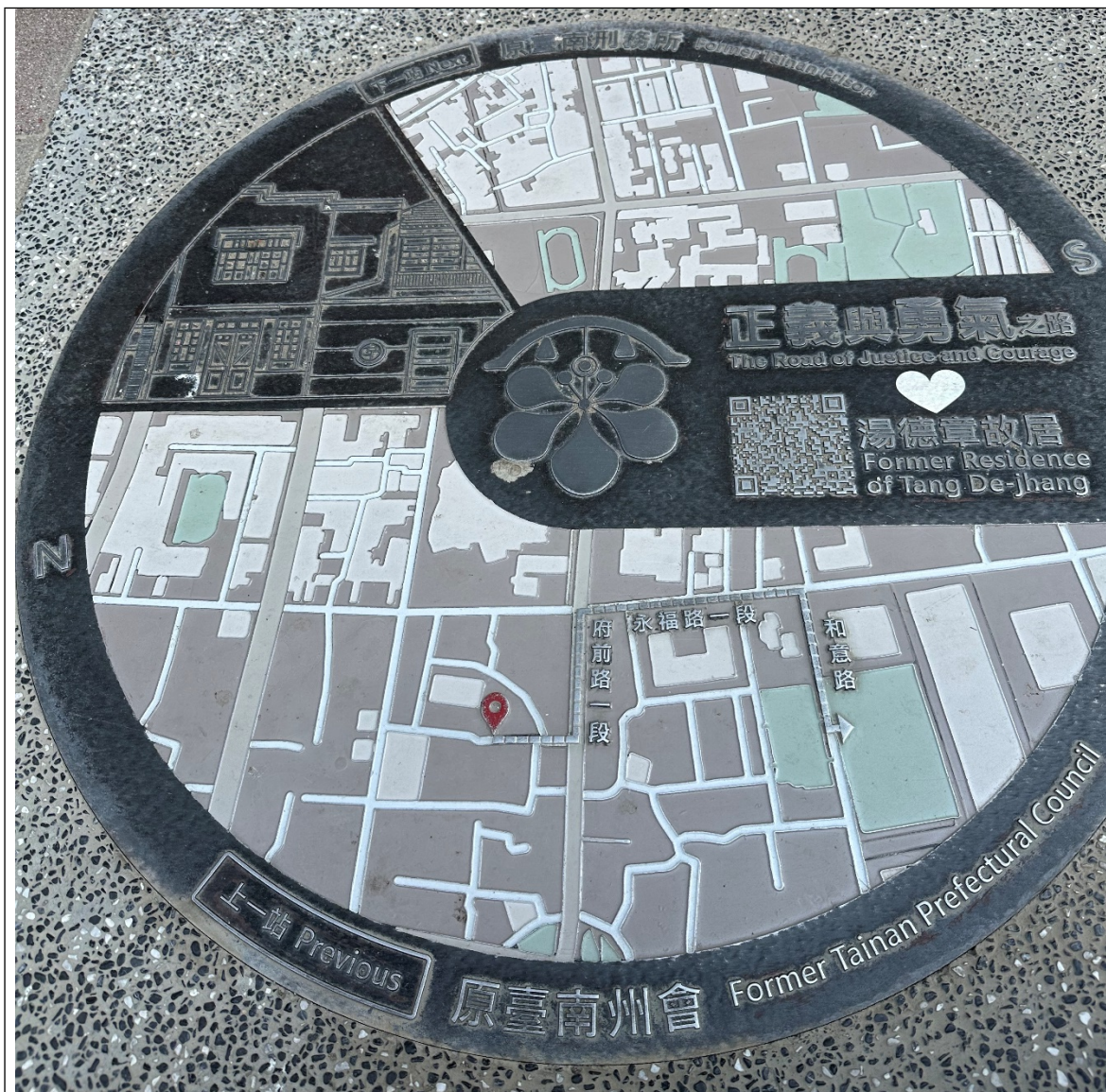
正義與勇氣之路-人行道鋪設之地圖指引