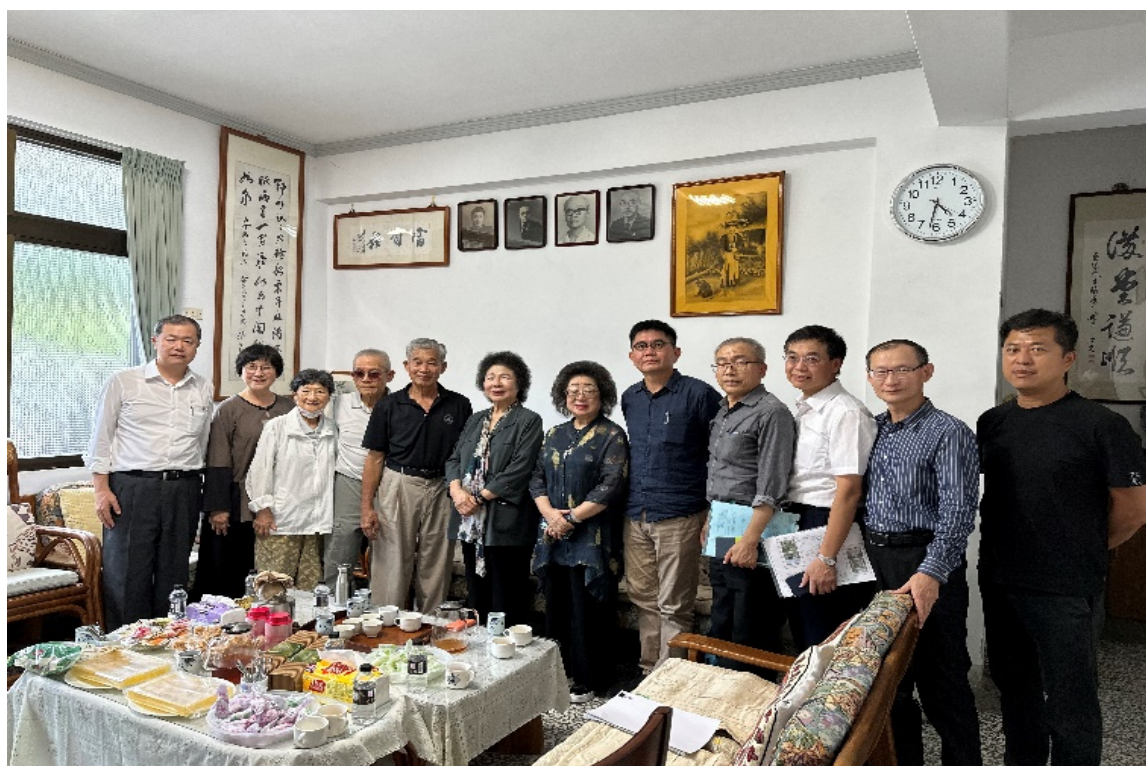
張七郎家屬訪談並反應現有維護管理之困境