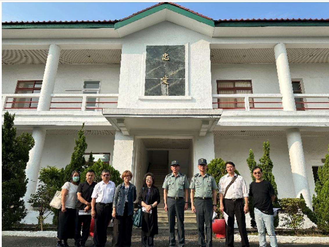
原高雄要塞司令部（228事件不義遺址）