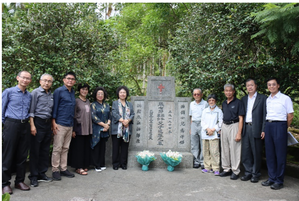
張七郎紀念墓園（太古巢農園）