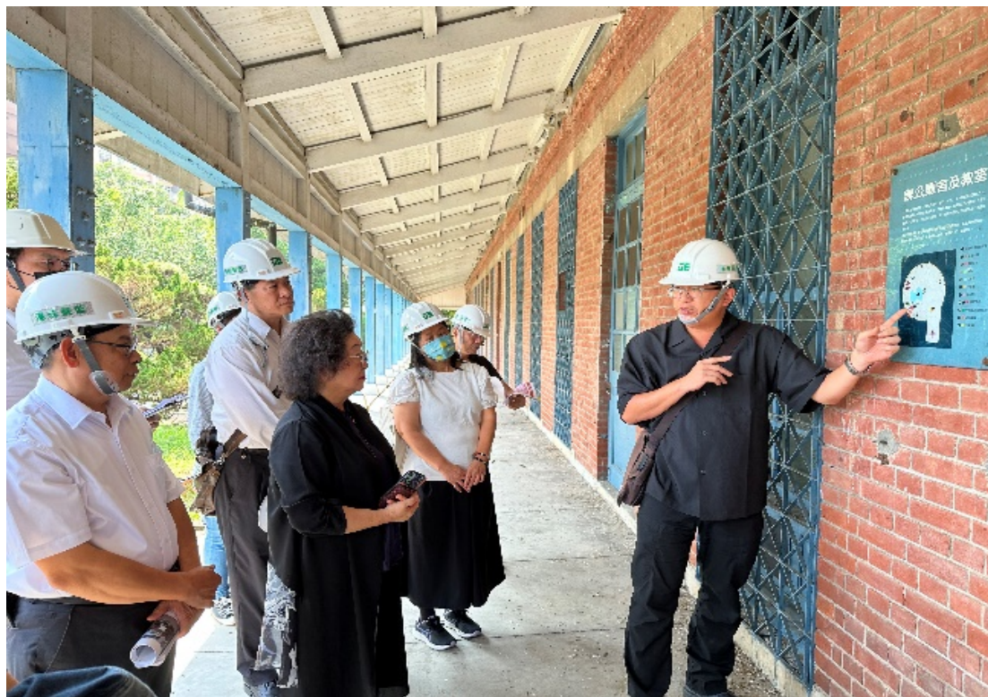
原海軍總司令部情報處拘留所（海軍明德訓練班）