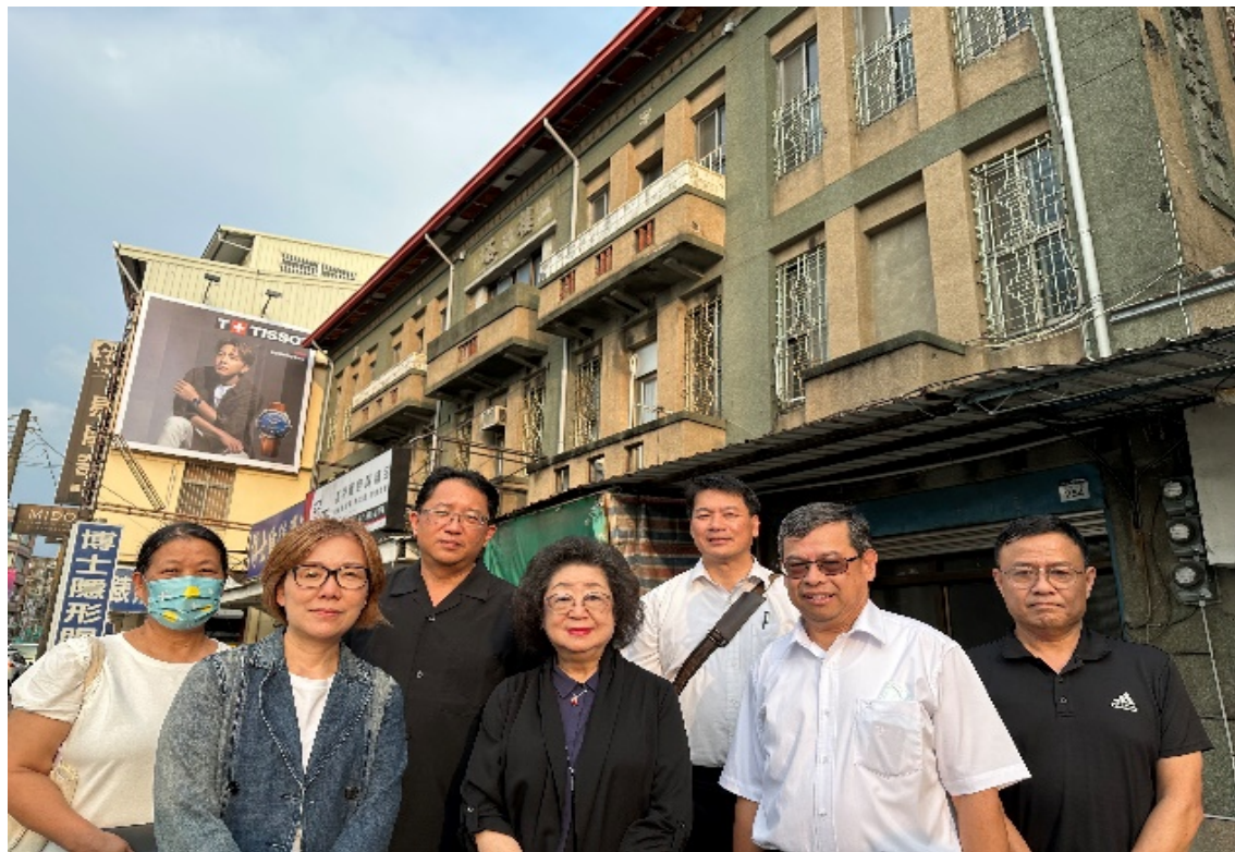
原海軍總司令部情報處拘留所 （私有產權白色恐怖潛在不義遺址）