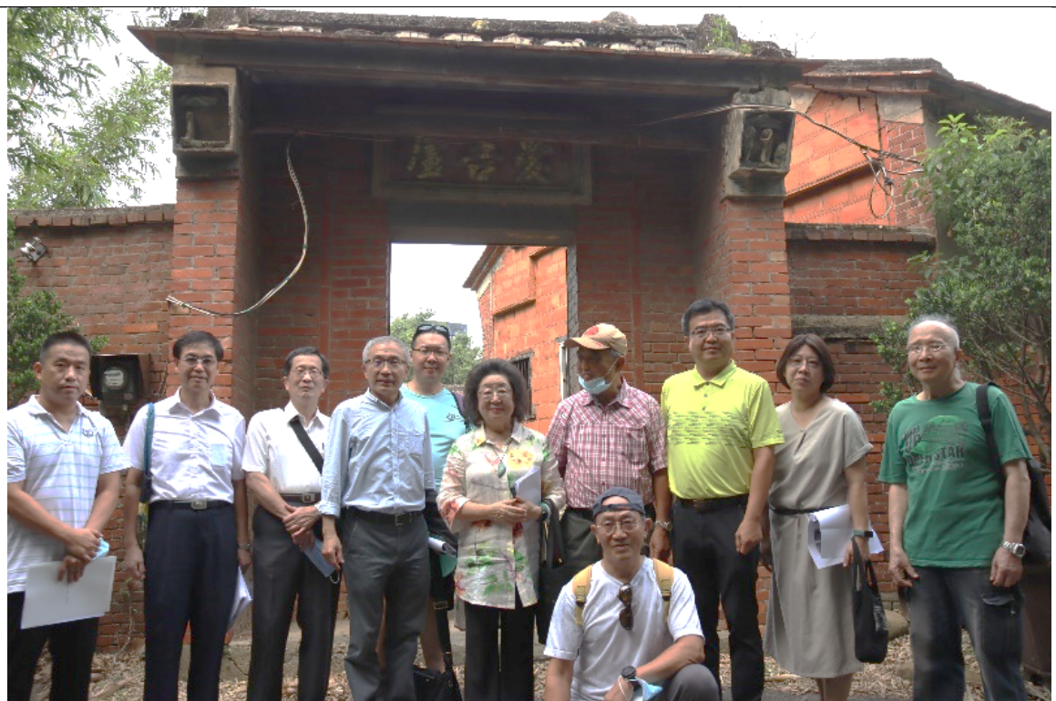
建築（愛吾廬）保留完好屬私人產權，四周布滿竹林