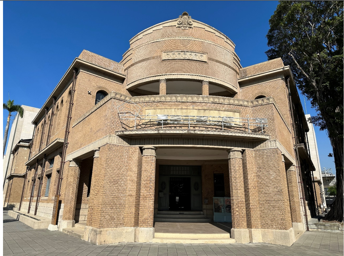
原臺南警察署（現為臺南市美術館一館）大門