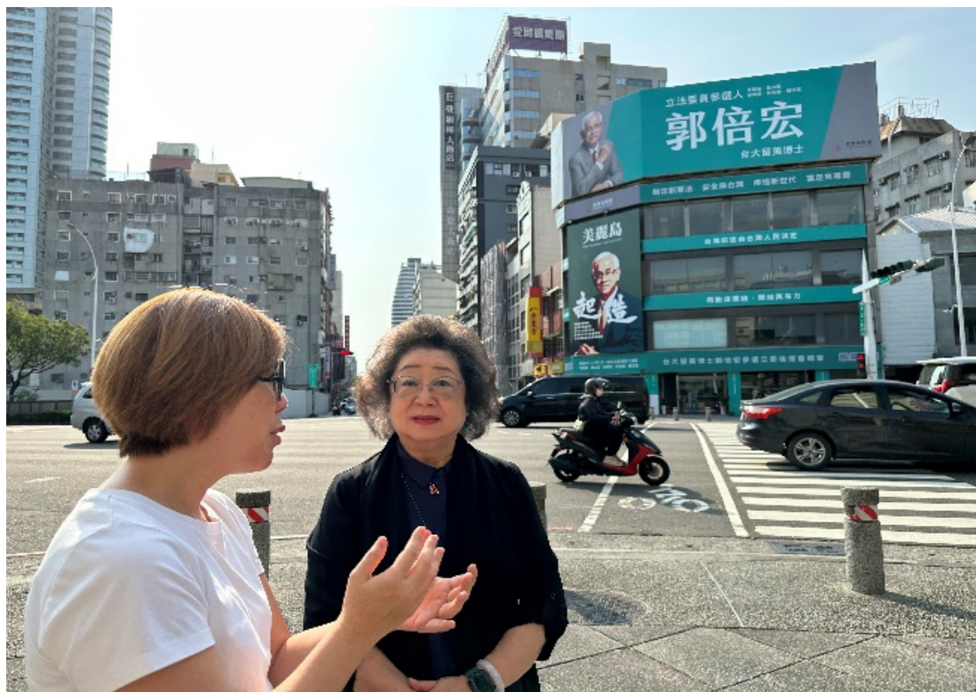
原美麗島雜誌社高雄市服務處 （私有產權白色恐怖潛在不義遺址）