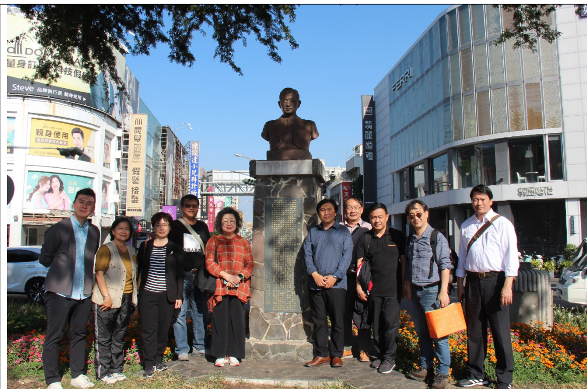
湯德章紀念公園（臺南原民生綠園；審定不義遺址）