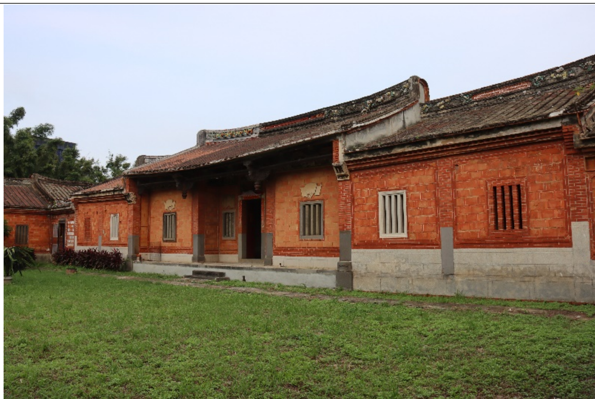
原國防部保密局桃園感訓所（桃園監獄、徐家祠堂、天牢） （潛在白色恐怖不義遺址）