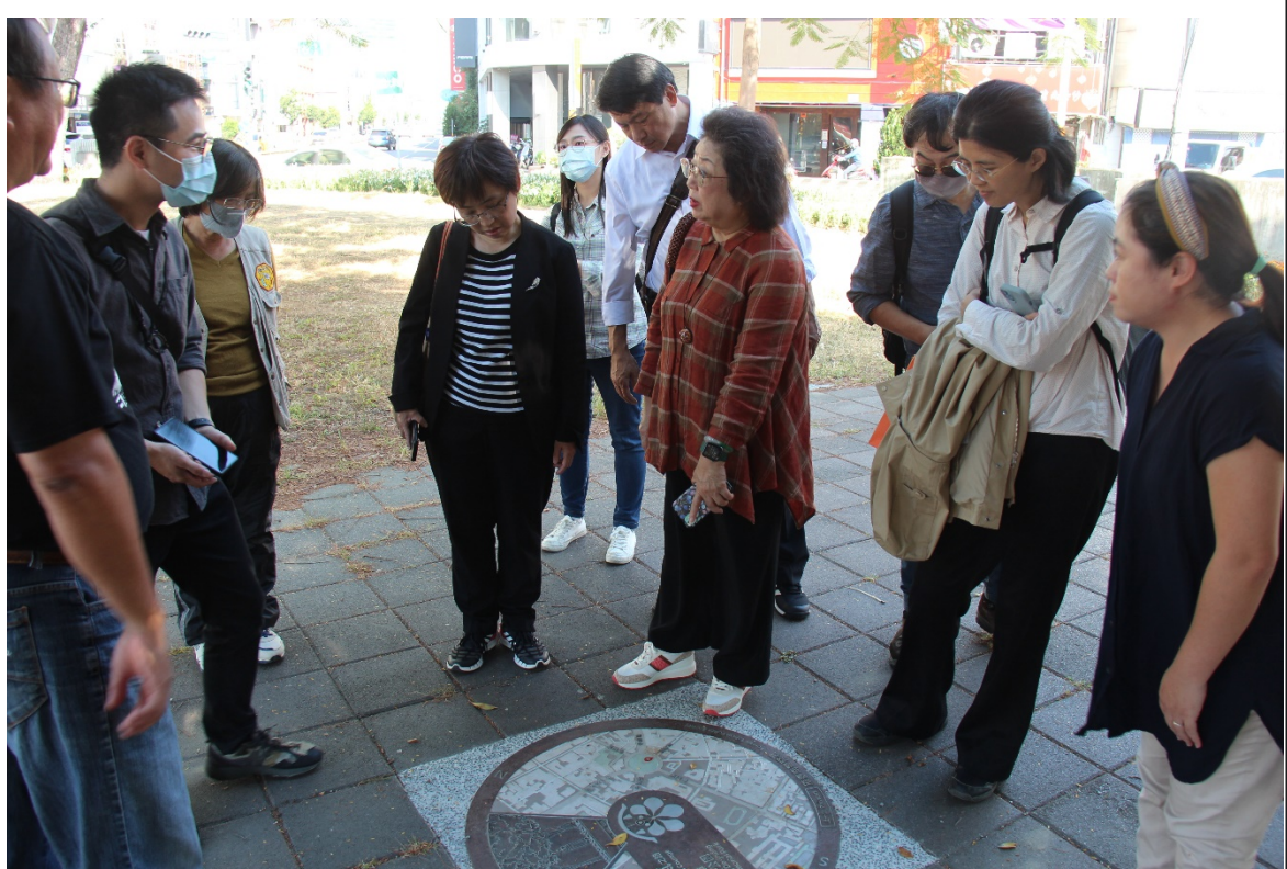
湯德章紀念公園（臺南原民生綠園；審定不義遺址）