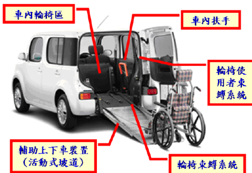
輪椅區車輛設備示意圖