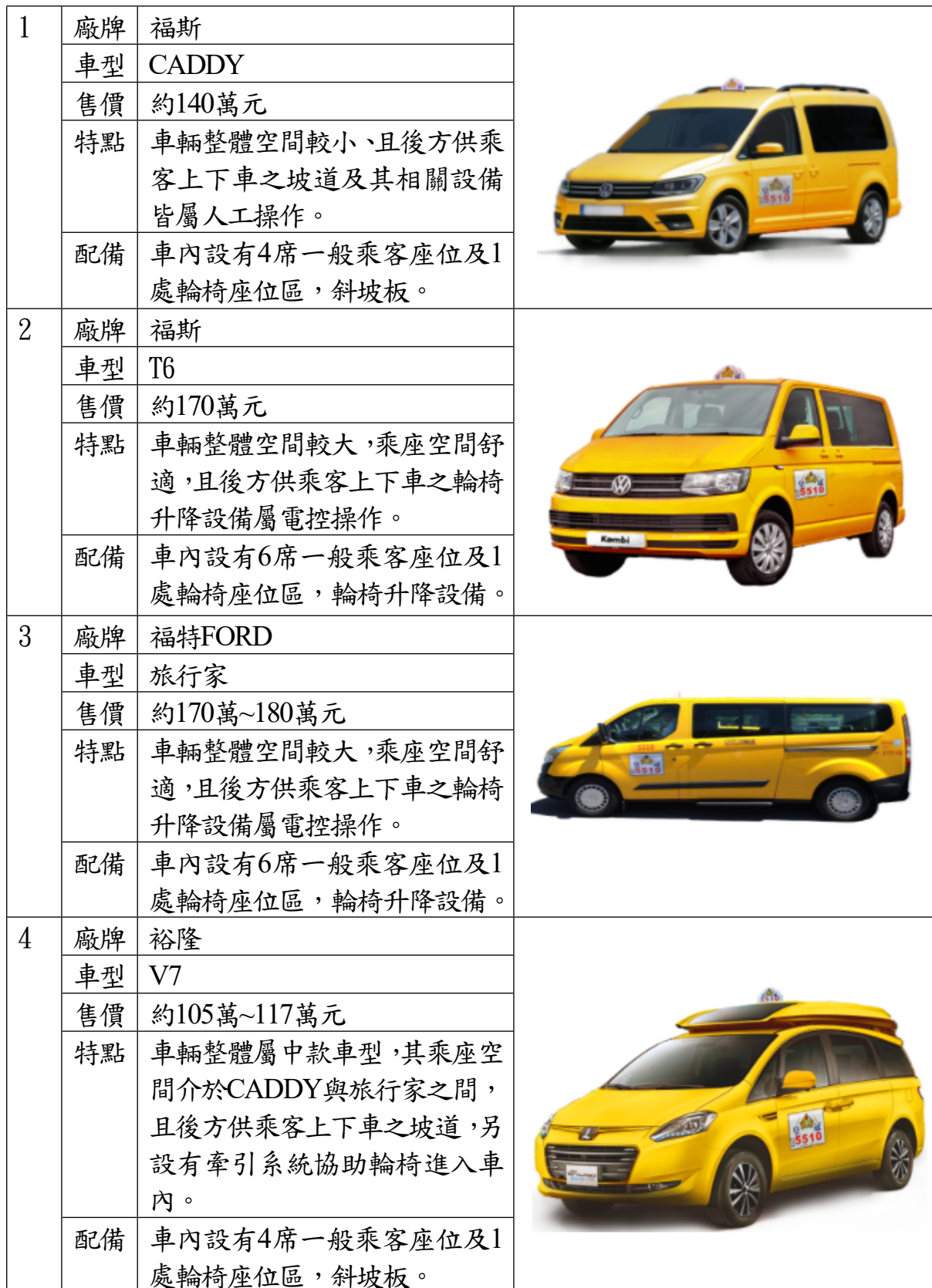
表1 符合國內車輛型式認證規定之無障礙計程車車型