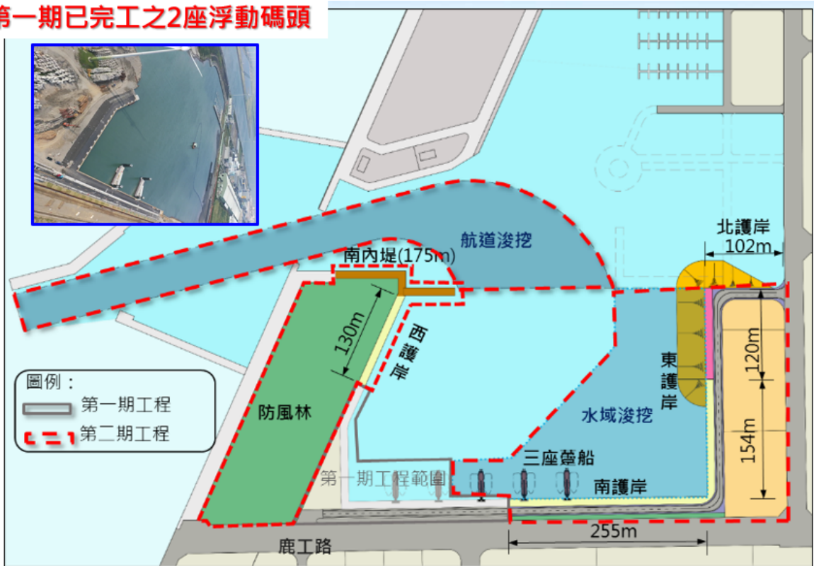
圖1 離岸風電運維基地工程分布圖