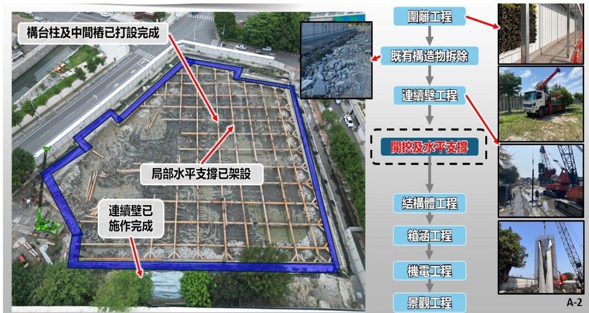
圖3 洛津國小停車場兼蓄洪池工程執行情況

經濟部核定公告實施範圍，補助辦理「鹿港鎮洛津國小操場設置地下停車場兼蓄洪池工程」(詳圖3)，工程主辦單位為彰化縣政府工務處，決標金額2億6,417萬2,326元，水利署補助2.2億元，彰化縣政府自籌0.44億元。經查，洛津國小操場設置地下停車場兼蓄洪池之細部設計報告已於111年9月核定，112年7月17日開工，至113年6月1日止，整體工程進度31%，預定114年3月14日前完工。