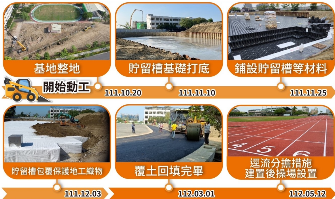
圖4 安佃國小逕流分擔施工過程

部補助操場整建暨逕流分擔措施建置經費（教育部補助700萬元，水利署補助5,528萬元），配合操場整建施設雨水積磚（1,792m 2 、深度1.29m，詳圖4），滿足分擔量體2,196m 3 ，且蓄積後的水體可供學校澆灌使用，工程主辦單位為臺南市安佃國民小學，於111年8月31日完成工程發包，決標金額5,400萬元，112年6月9日完工，完工後之逕流分擔措施維護管理工作由學校總務主任負責，維護經費概估約15萬元/年。