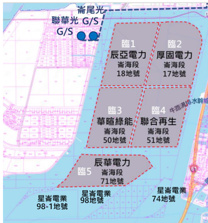
圖1 彰濱工業區海域太陽光電案場位置圖