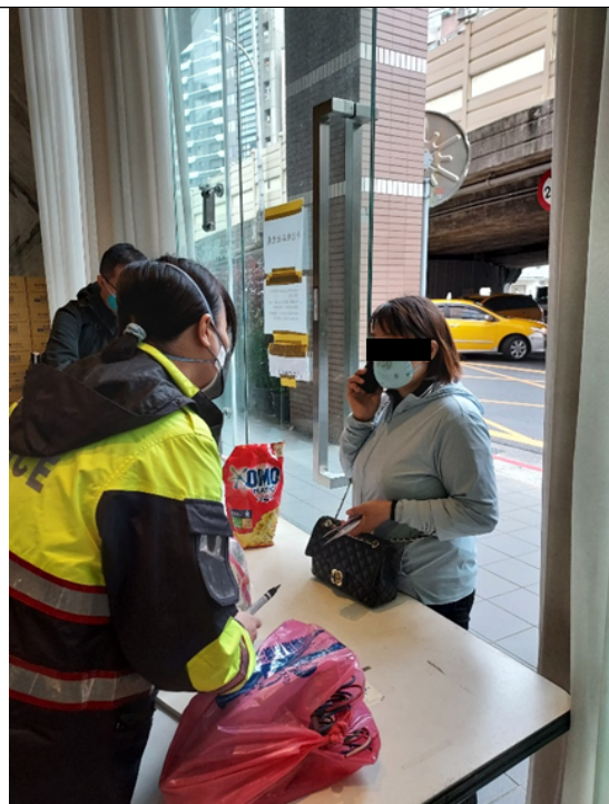
親友送入物資，安全組人員當場確認，退回水果請親友攜回