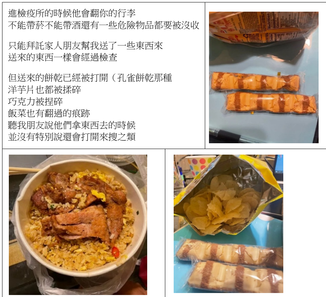
表1 「檢疫所的人翻我飯菜」貼文重點摘錄