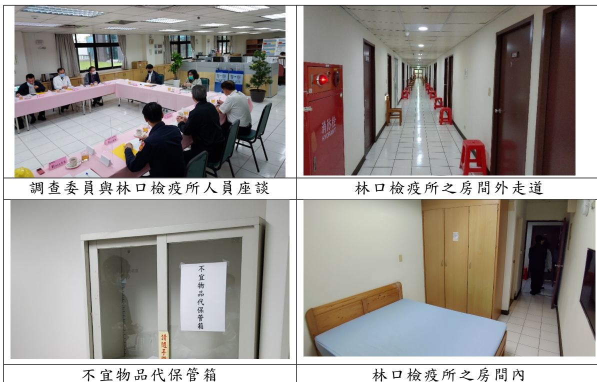
照片1 中央徵用林口檢疫所