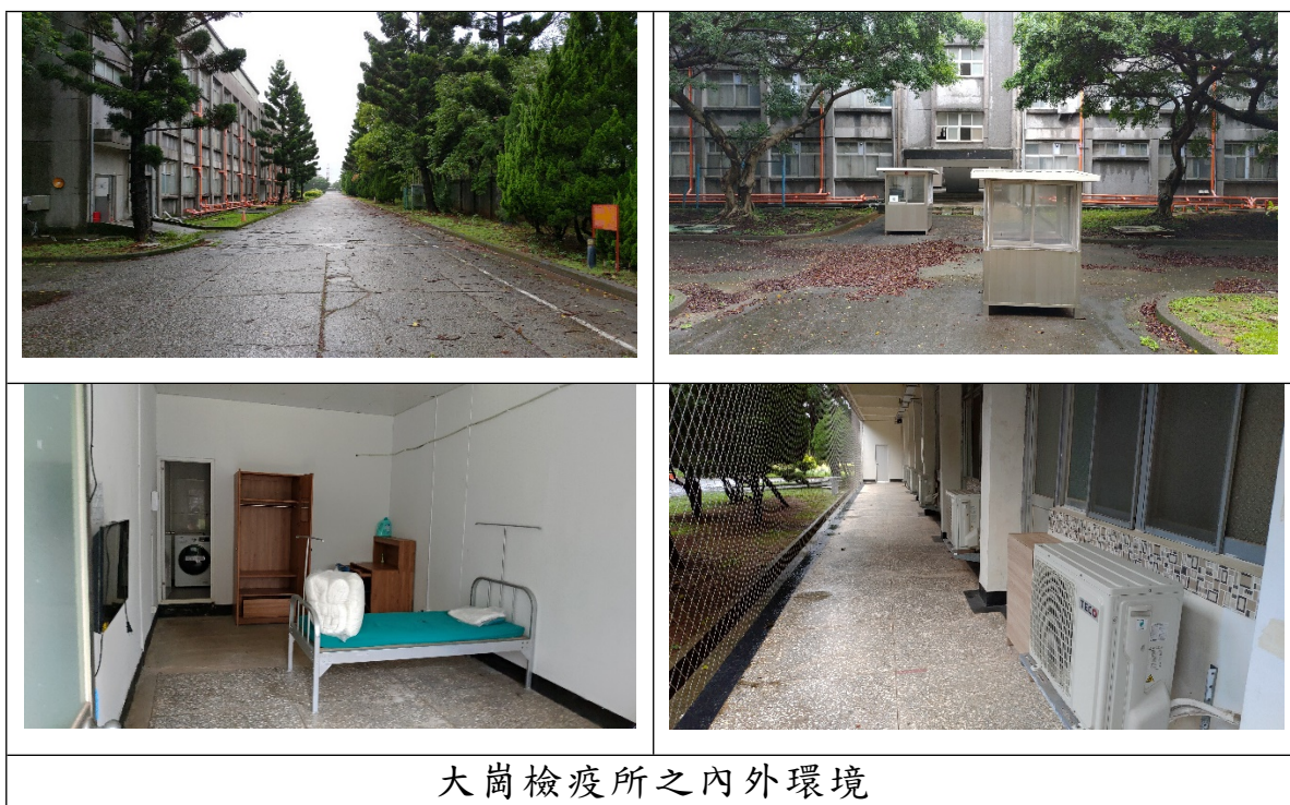
大崗檢疫所之內外環境