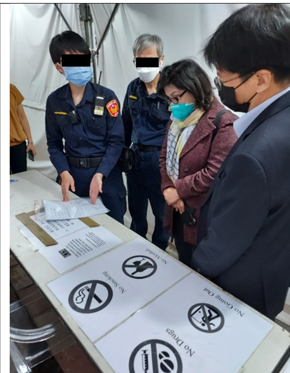
住民入住時行李檢查流程及禁止攜入物品說明

2、本案履勘時適逢有住民親友親送物資到所，安全組人員檢視後，退回水果請親友帶回；檢疫所人員向本院說明，因為住民沒有水果刀，無法食用送入的水果，所以退回。