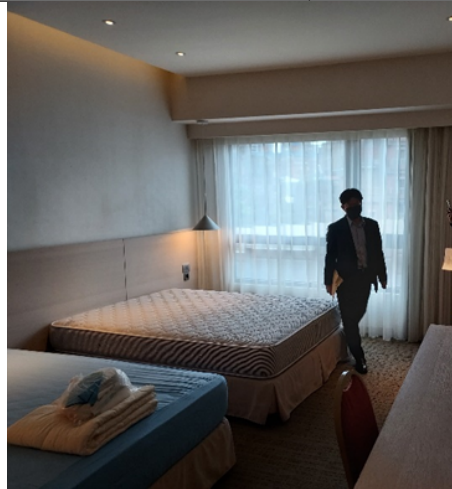
萬華檢疫所的房間內與盥洗空間