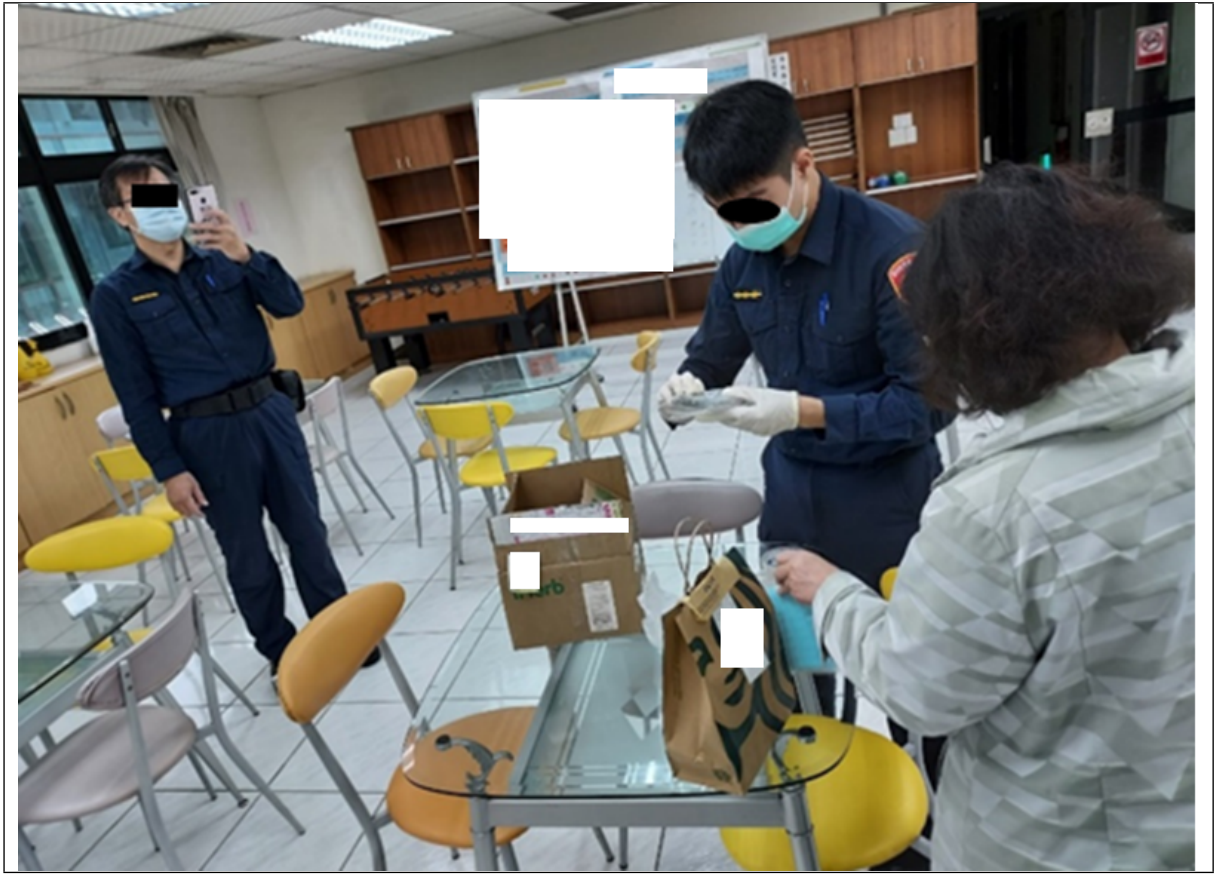
照片2 林口檢疫所對送入物資進行安全檢查

夾鏈袋裝藥品，請衛生組協助確認；其他內容物以目視方式檢查，並無再進一步拆封檢查。