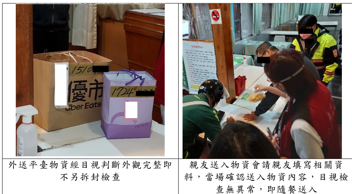
照片8 安心檢疫所對送入物資進行安全檢查

4、本案履勘時適逢有外送平臺及住民親友親送物資到所，安全組與後勤組人員依正常作業流程實施安全檢查。