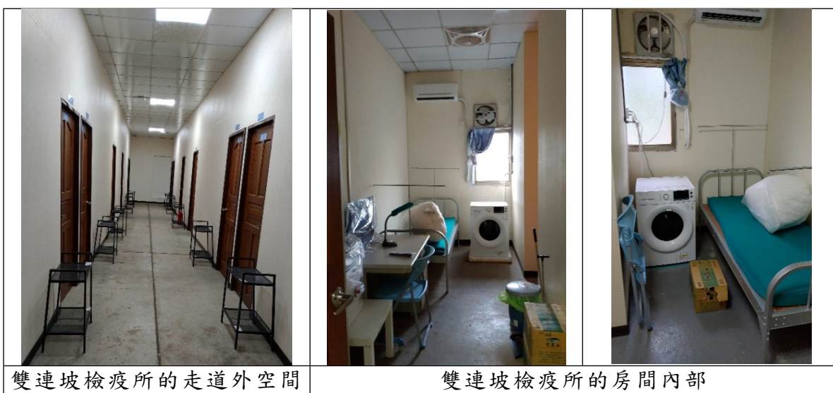
照片4 中央徵用雙連坡檢疫所

「我們都沒有讓住民簽(自願接受檢查)同意書」、「我們的標準是如果是親友送來的東西，會比較嚴格的檢查，如果是外送平台送來的東西，則比較寬鬆」、「我們這裡沒有查過毒品那類的違禁品，慢性病的藥物那種可以，其他種類的藥品要問醫生，我們這裡有視訊看診，可以提供藥物」。