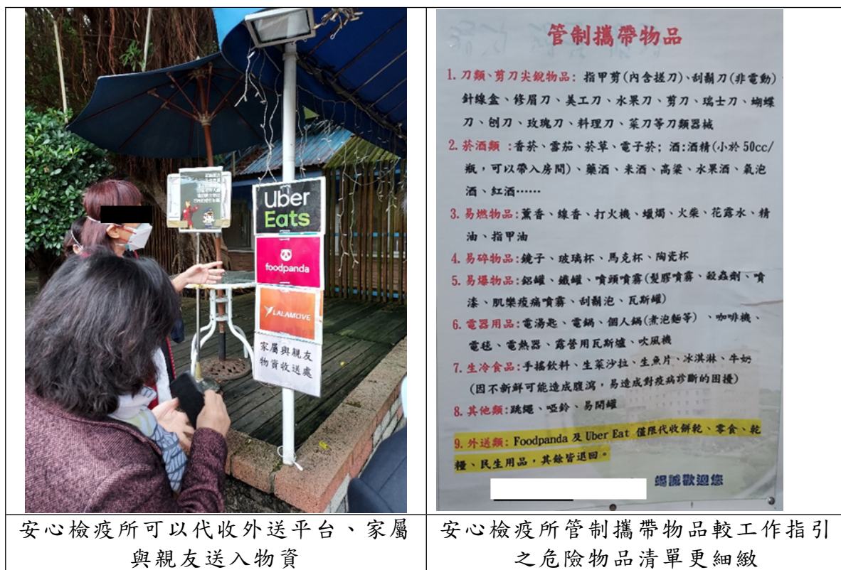
照片7 臺北市徵用安心檢疫所

4、本案履勘時適逢有外送平臺及住民親友親送物資到所，安全組與後勤組人員依正常作業流程實施安全檢查。