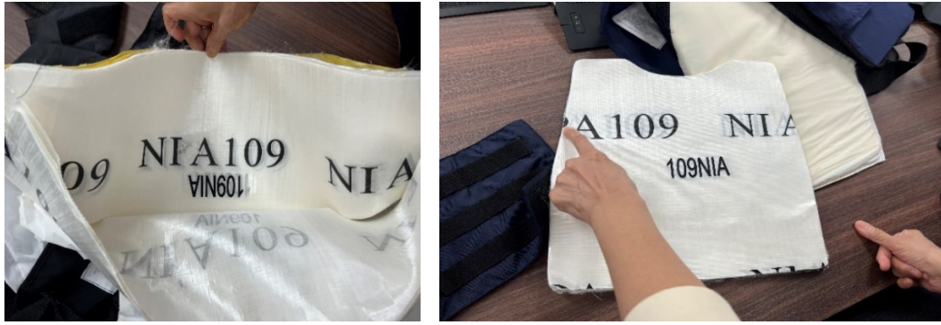
圖4 移民署 109 年採購案防彈衣成品內裡之防彈纖維布