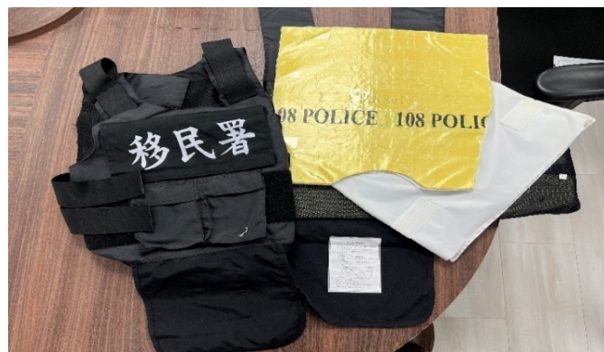
圖3 移民署 108 年採購案防彈衣成品內裡之防彈纖維布

將成品運送至移民署，經該署人員現場查驗且清點數量無誤後，由主驗人隨機抽取 3 件後當場封緘，再由該署人員郵寄送交公正單位進行第 2 階段測試，其中 1 件送至 Y 檢驗公司檢驗樣品尺寸；1 件送至 W 大學實施剛柔度測試；1 件送至美國 X 實驗室進行抗彈性能測試，測試完成後交由移民署保管。移民署分別於 109 年 6 月 4 日及同年 7 月 16 日完成上開 2 階段之驗收。依契約規格二、(二)1.(5)規定，防彈衣之前胸防彈纖維布板表層，須有「108NIA」標楷體，字型 72 號黑色戳印。然經查移民署存管中之防彈衣發現，防彈衣內裡每一層防彈纖維布均印有「108POLICE」字樣，明顯與本案契約規定應印有「108NIA」不同，其係與上開警政署背心式防彈衣案之契約規定，每一層防彈纖維布應印有「108POLICE」字樣相同；另防彈衣於內裡第一層防彈纖維布，依契約規定應採用「戳印」方式標示「108NIA」字樣，實際係另以「黏貼」方式貼標，且字體較為模糊不清楚。E 公司有將前揭警政署背心式防彈衣案驗收不合格之背心式防彈衣舊品（108 年間製造），轉作為承攬移民署辦理本案履約交貨之嫌。