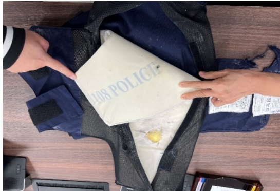
圖5 臺灣銀行 108 年度採購案防彈衣成品內裡之防彈纖維布

收，驗收人員斷非得據此即可免除其所應負擔之責任，顯見驗收作業顯有重大疏失，應予檢討。