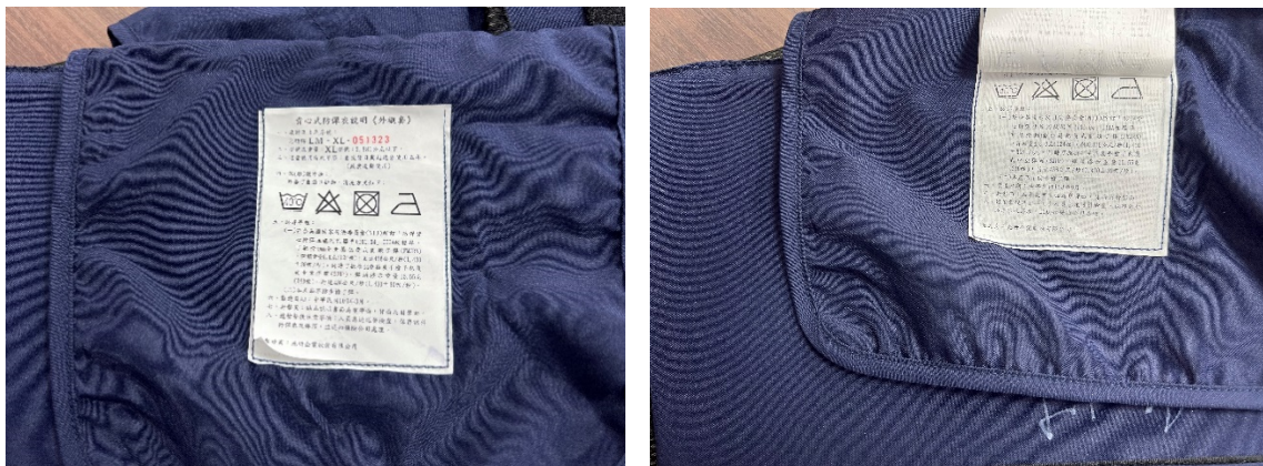
圖1 警政署留存防彈衣成品外襯套雙層複貼修改說明標籤

(二)然查，警政署上述「背心式防彈衣47,892件」案，第4批驗收合格後留存於該署3件防彈衣，均發現防彈衣成品內外襯套之說明標籤有雙層複貼修改情形，其中下層之說明標籤係車縫固定，其上則另有一層以黏貼方式之中文說明標籤，且下層之說明標籤為同採購案不合格之防彈衣出廠序號及製造日期，包含第2批外襯套1件，第3批內襯套1件，內襯套相關資訊被塗銷2件，得標廠商涉有將其前批次驗收不合格之防彈衣，轉作為第4批之履約交貨，惟警政署辦理第4批防彈衣驗收時未能及時發覺，顯有違上開規定，核有重大疏失。