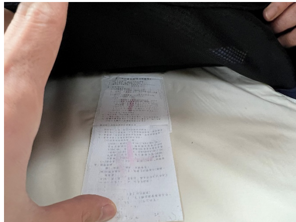
圖2 警政署留存防彈衣成品內襯套雙層複貼修改說明標籤