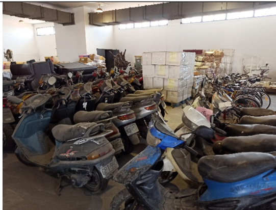
扣押物置於積灰嚴重庫房內，久未發動 攝於南部大型贓物庫