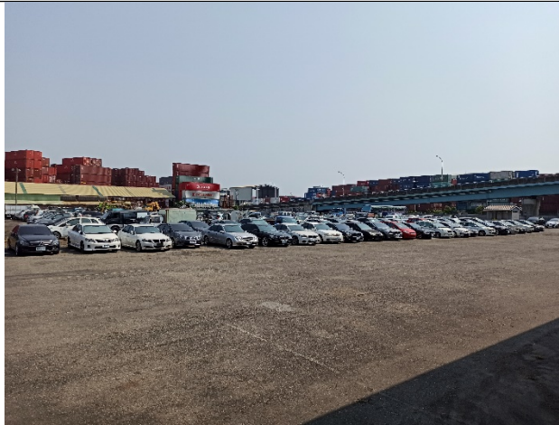
開放式空間，扣押物所處環境烈日曝曬，久未發動 攝於南部大型贓物庫