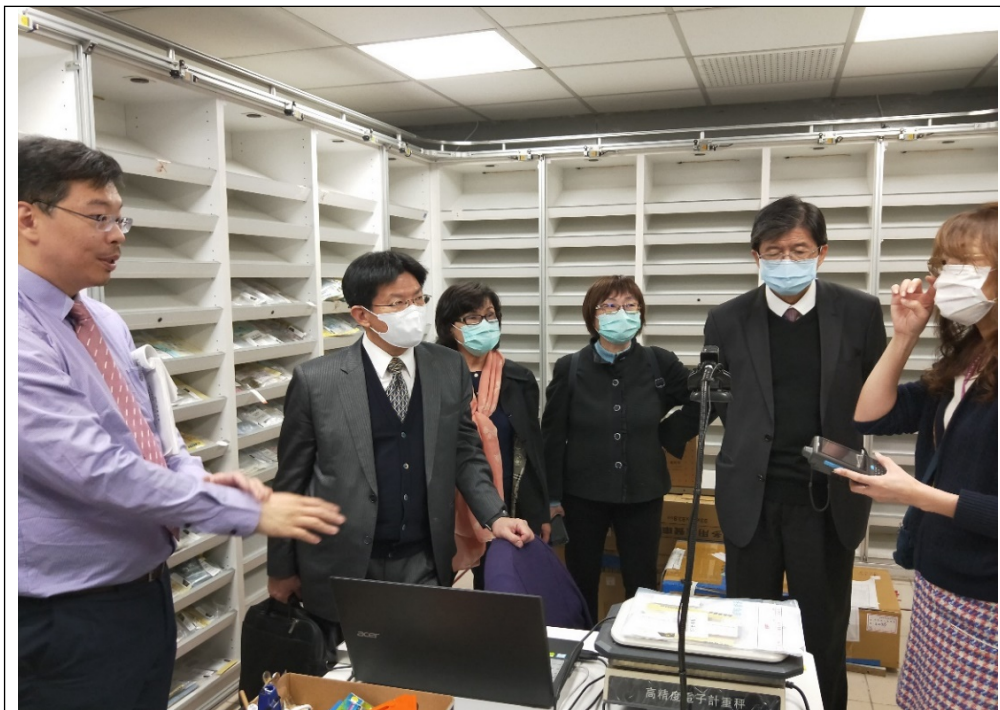
地點：臺中地檢署贓證物庫(存放子彈空間)

(三)109年4月13日赴臺中地檢署、臺中地院及法務部中部大型贓證物庫實地履勘。