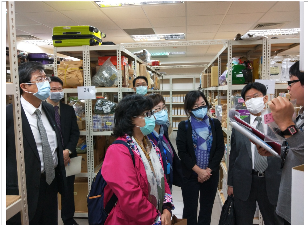
地點：桃園地檢署贓證物庫