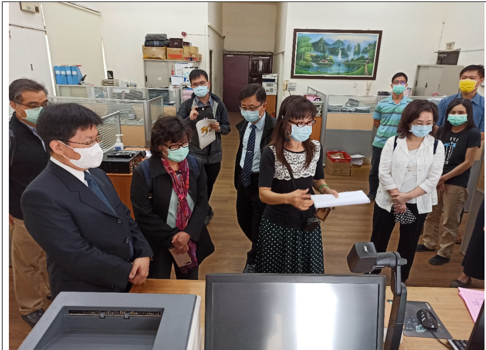
地點：高雄地檢署贓證物庫(左營)

(三)109年4月13日赴臺中地檢署、臺中地院及法務部中部大型贓證物庫實地履勘。