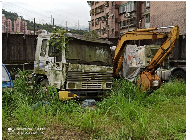
開放式空間，扣押物所處環境溼度高，長滿清苔 攝於北部大型贓物庫