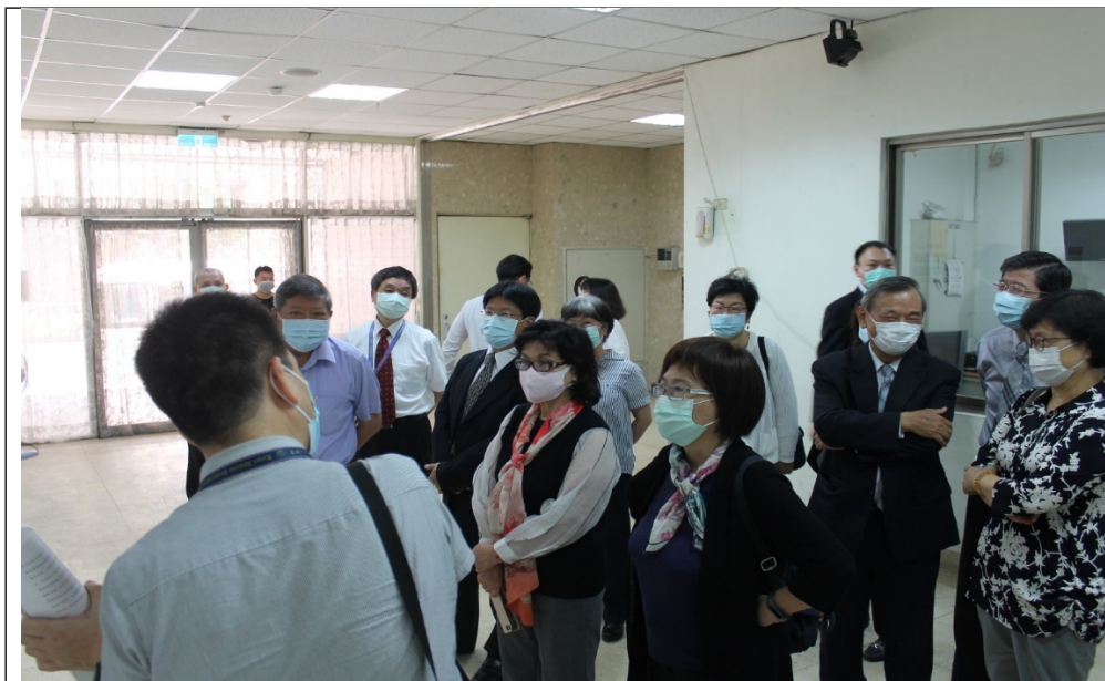
地點：臺北地檢署贓證物庫