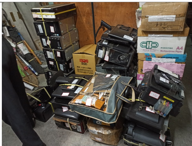
扣押物為3C電子商品，歷經司法警察機關、檢察署及 法院階段雖無鏽蝕，但價值減損速度快 攝於高雄地院