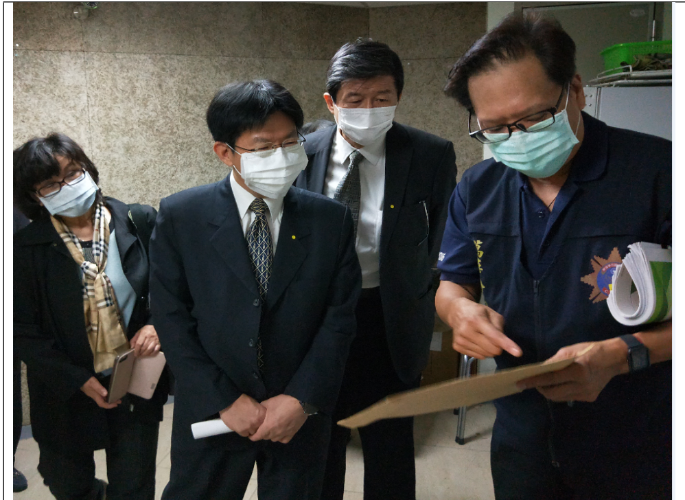
地點：臺北市政府警察局萬華分局贓證物庫

(四)109年4月28日赴臺北市政府警察局萬華分局及刑事警察大隊贓證物庫實地履勘。