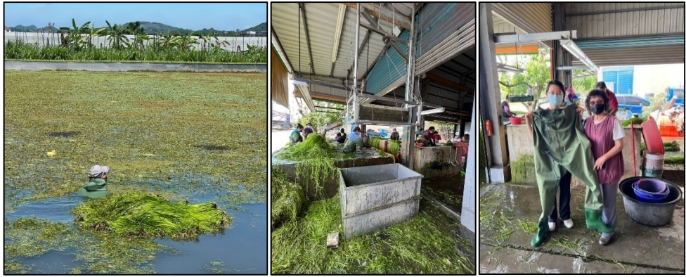
下水採收野蓮的泰籍移工