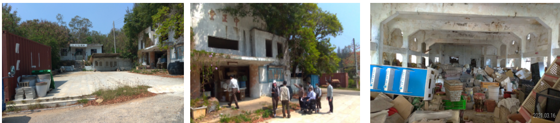
圖三 武威二營區（公私有土地夾雜）

理，除造成金管處所接管軍事建築無法修建維護之困境，亦間接引起毗鄰土地公共衛生與環境治安之疑慮，甚至部分營區現場之建物呈現毀壞荒蕪之現象。以該處所接管武威二營區(現況照片圖三)為例，即可發現該營區位處與私有民宅交雜之處，而營區範圍內更有多棟建物，其中建築形式較具規模之中正堂，卻因位處私有土地，因迄今無法與土地所有權人達成協議已取得土地合法之使用，故至今無法進行整建修繕，以致建物逐年毀壞頹圯，空置的建物亦容易成為治安死角，徒增管理之困擾。