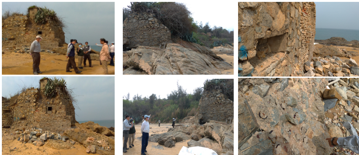
圖二 紅土溝一營區（海防據點）

三、針對公私土地交錯產權複雜之軍事營區，允應儘速擬具妥適處理計畫，建立齊一管理維護機制，避免具有歷史保存珍貴軍事建物因失管或無法管理而致頹圯滅失。