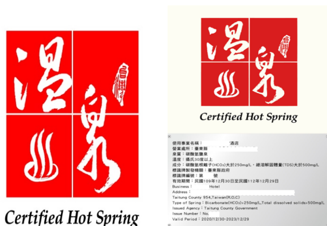
圖1 溫泉標章（左）與溫泉標章標識牌（右）之型式

使用事業若未依溫泉法第 18 條之規定取得溫泉標章而營業者，由直轄市、縣（市）觀光主管機關處 1 萬元以上 5 萬元以下罰鍰，並得按次連續處罰，合先敘明。