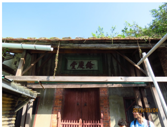
照片 5、古蹟隳壞情形