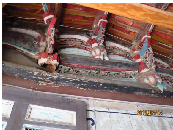
照片 2、門檻被鋸掉(左)、原有木棟架斷裂(右)