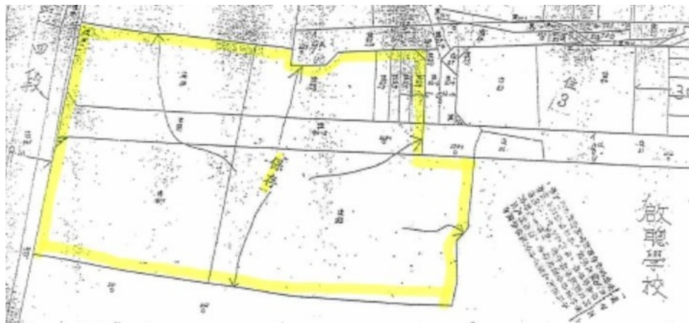
圖2 臺北市三級古蹟陳悅記祖宅(老師府)保存區範圍