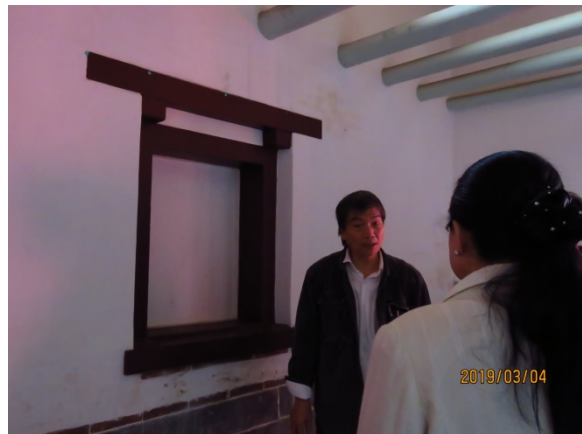
照片 1、古蹟原貌遭變更，屋脊粘黏消失不見(左)、窗戶型式變更且封閉(右)