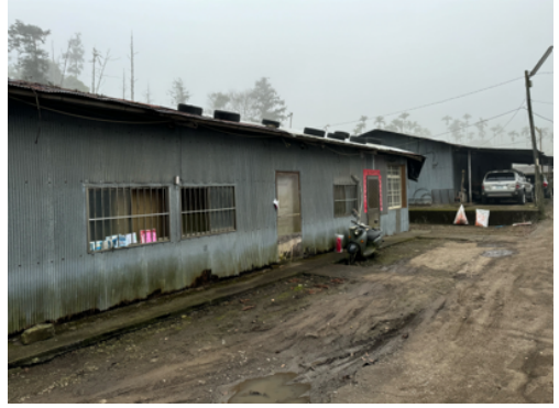
圖8 遺址地遭占用、違建