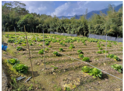
圖12 祭祀地遭設置菜園