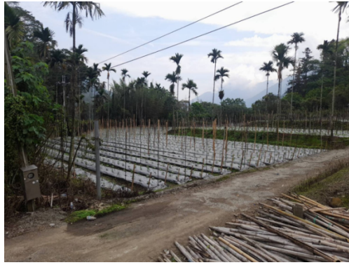
圖13 祭祀地遭種植檳榔