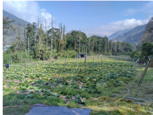
圖14 現地違規使用情形不斷