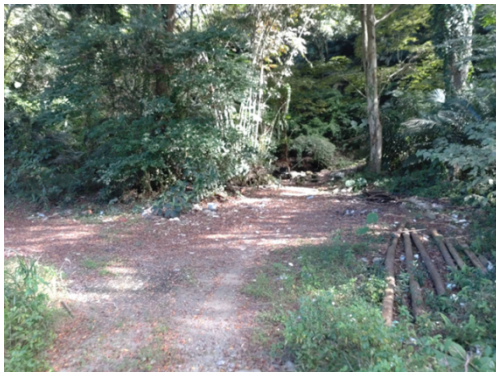
圖5 桐林段81地號入口處

1、入口處（桐林段81地號）曾遭違規放置資源回收物，臺大實驗林管理處已排除占用。114年3月間現況如下：