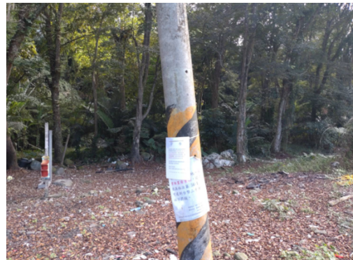
圖6 現地已排除占用