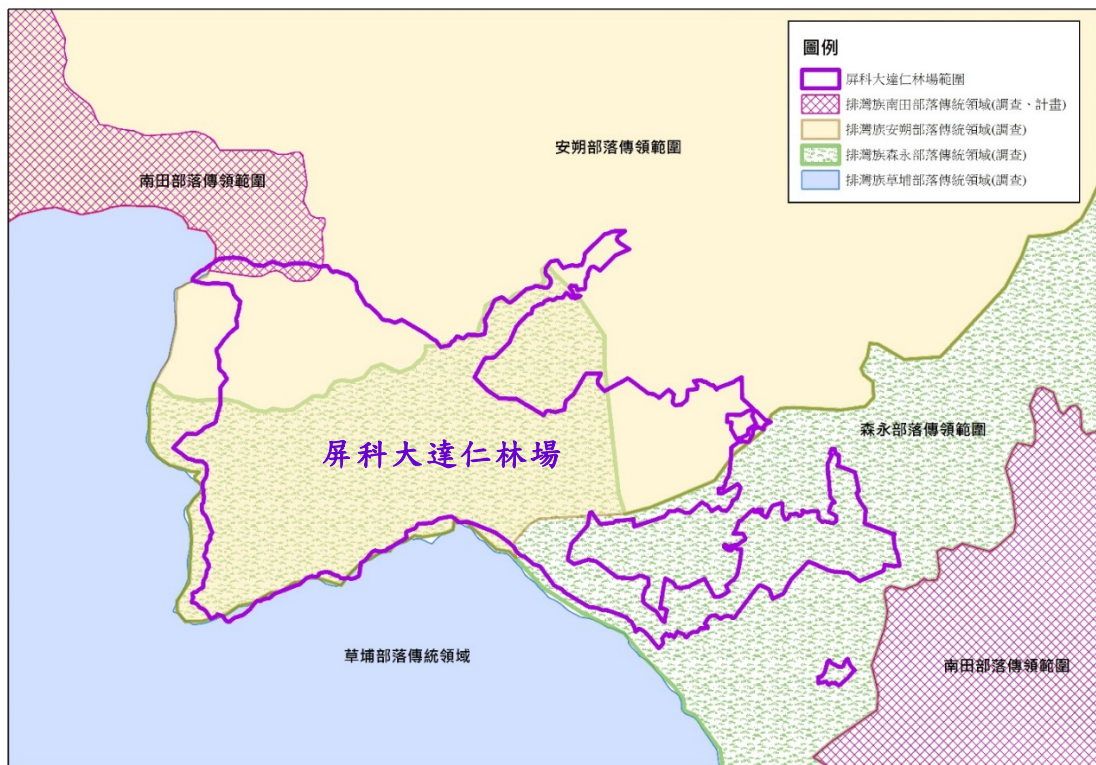
圖3 屏科大達仁林場與排灣族（南田、安朔、森永、草埔部落）傳統領域重疊情形

安朔部落，而Ruvaniyau家族則是被遷至屏東縣東源部落。1938年日本政府為發展熱帶栽培業，經山地開發委員會調查認為臺東適合優先推動，而將第17號阿塿衛溪流域地貸渡（日治時期名詞，指政府租借官有財產予民間使用，僅具使用權，所有權仍歸政府）給森永拓殖株式會社，種植咖啡、可可等熱帶作物，始稱為森永事業地。有關屏科大達仁林場重疊於排灣族之傳統領域情形，詢據原民會提供圖資如下。