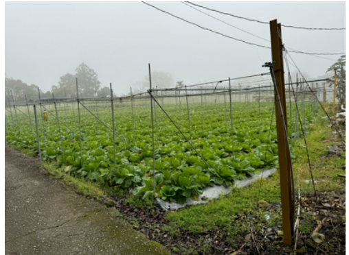
圖10 遺址地遭占墾未排除