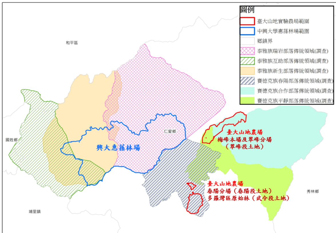
圖2 臺大山地農場與賽德克族（春陽、合作、平靜部落）、興大惠蓀林場與泰雅族（瑞岩、互助、新生部落）之傳統領域重疊情形