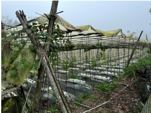
圖9 遺址地仍遭占墾