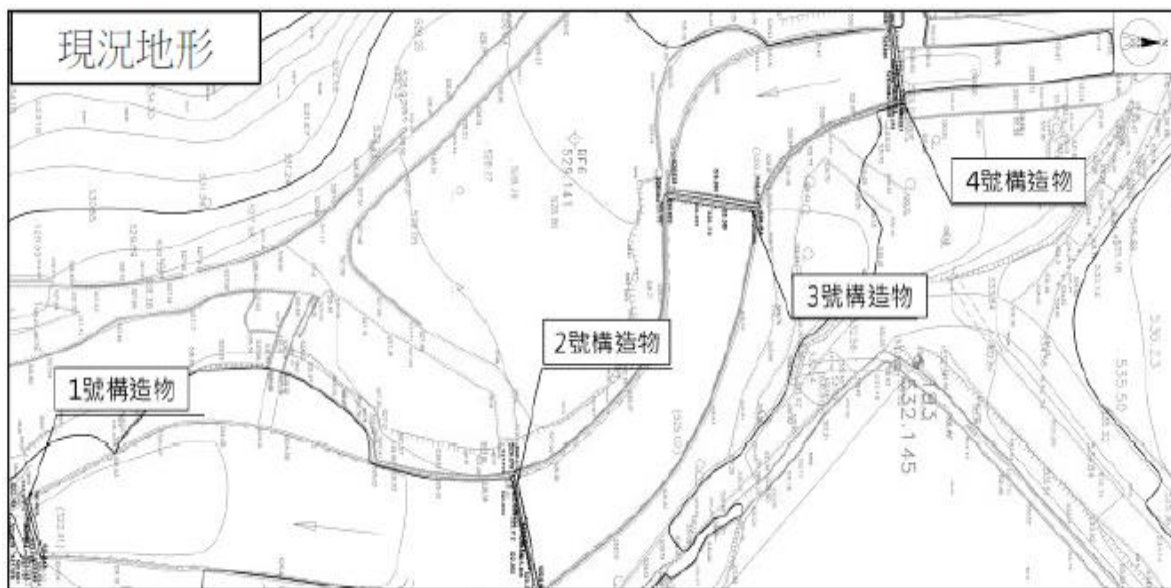
圖1 4座攔砂壩位置圖

(一)埔里農莊於剗牛坑溪上游逕自建造4座攔砂壩，據南投縣政府指出，該4座攔砂壩於111年8~9月期間施設完成，南投縣議會副議長於113年2月6日邀集南投縣政府相關單位至現場勘查，始發現該處野溪上游存有此4座攔砂壩，相關位置如下圖。