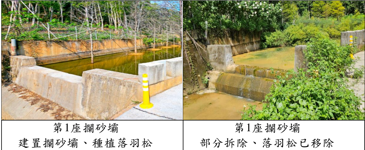
照片1 第1座攔砂壩照片