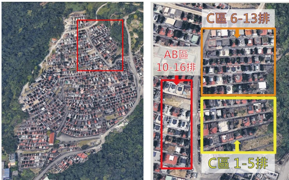
圖2、春秋墓園邊坡崩塌位置及受災影響墓基區位圖