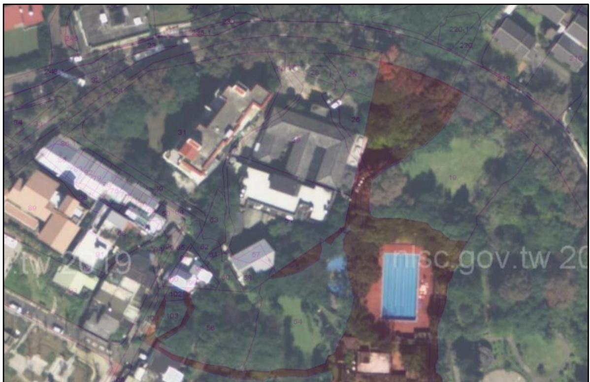
圖2 國際大旅館占用土地航照圖