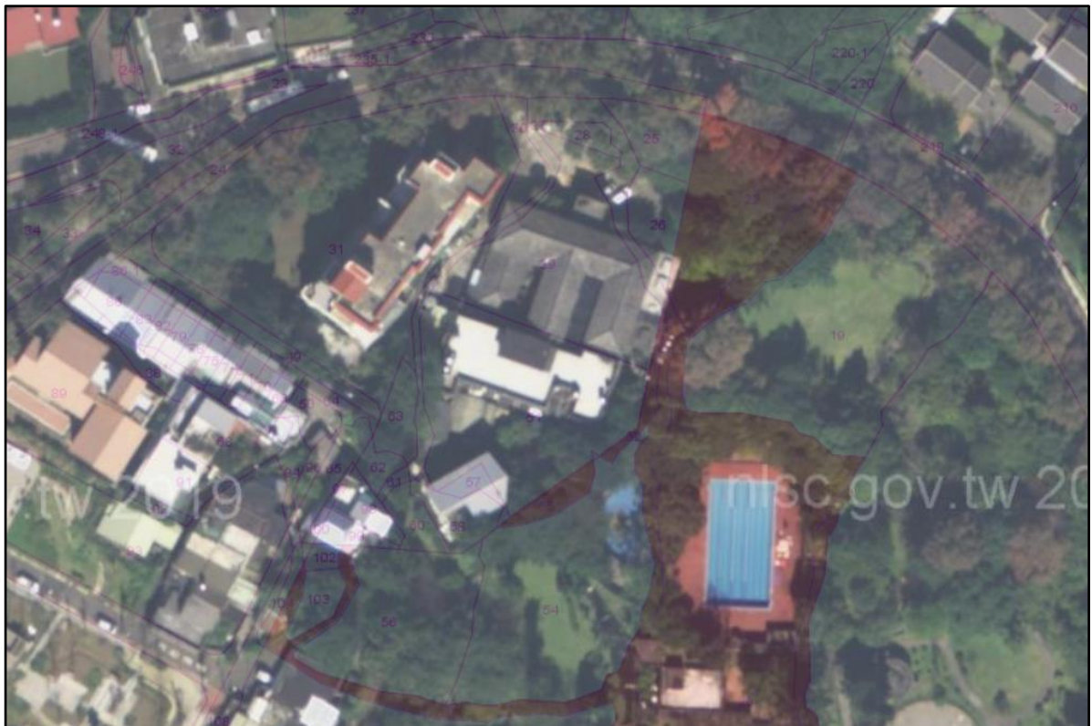
圖2 國際大旅館占用土地航照圖