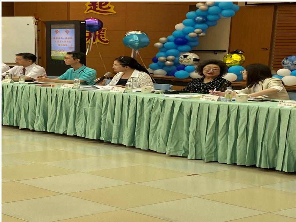
照片7、調查委員與教育部、南大及南聰等機關人員座談