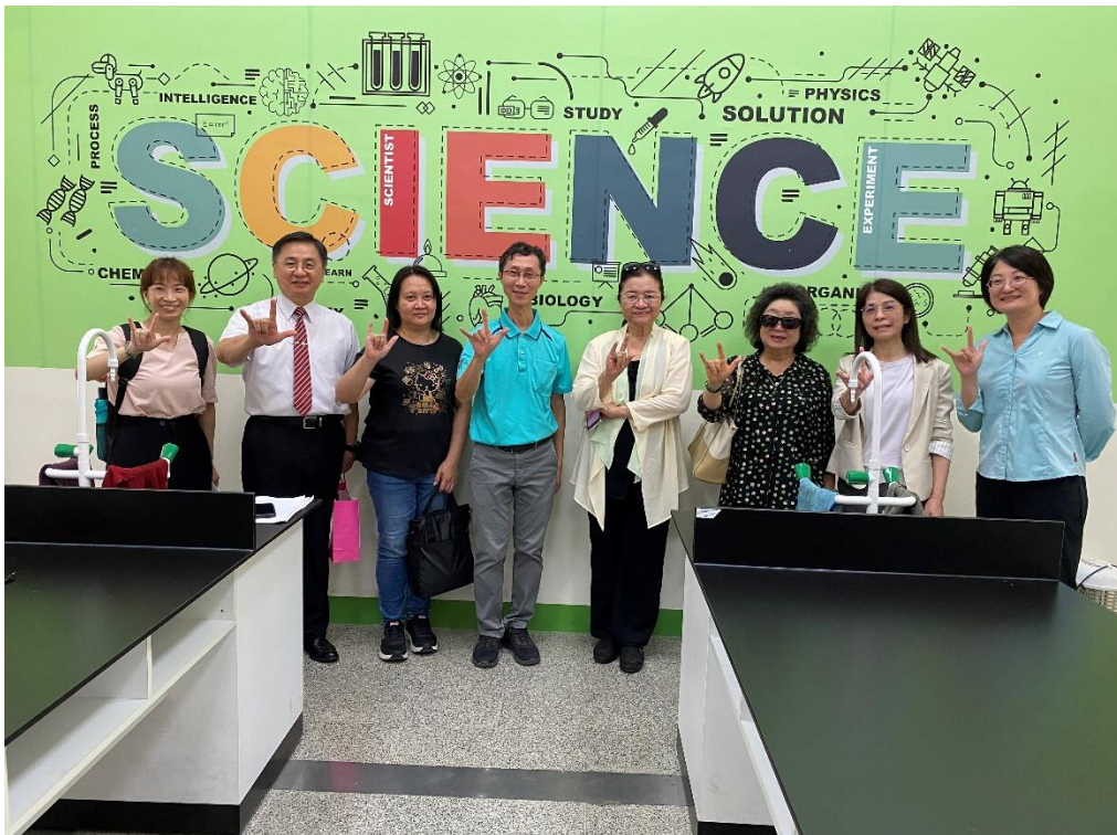
照片3、調查委員視察南聰科學教室