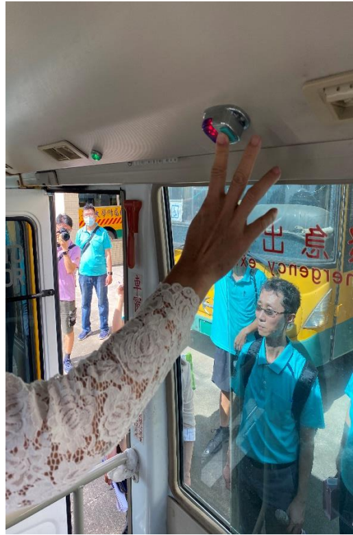
照片6、調查委員搭乘校車、並視察校車上之緊急求救鈴等設施