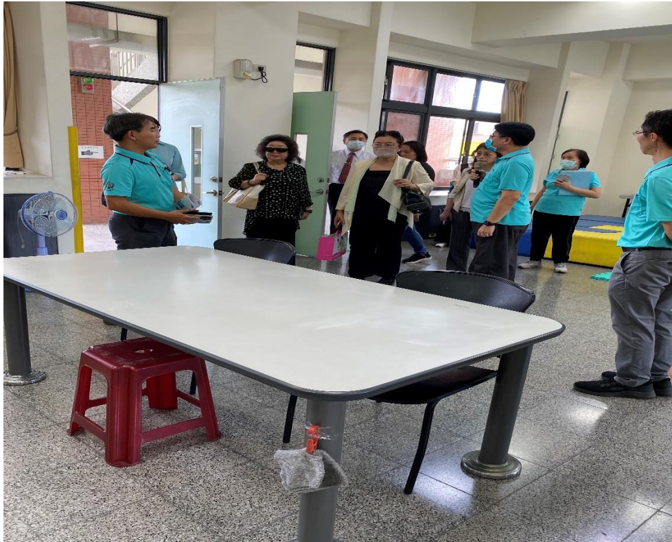
照片2、調查委員視察南聰設施設備