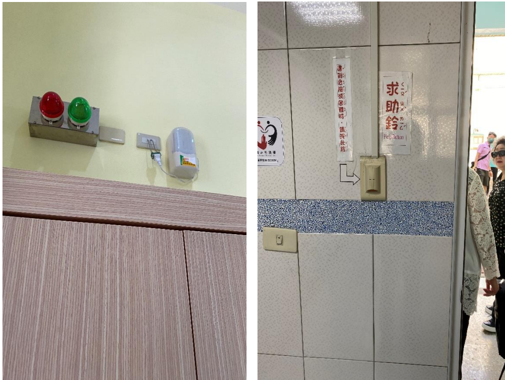
照片4、南聰上下課警示鈴、緊急求救鈴