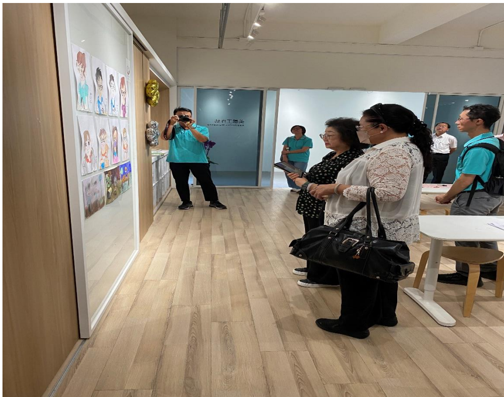
照片5、調查委員參觀學生作品