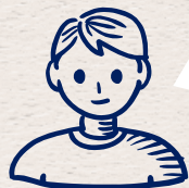
公職營養師 及專家學者