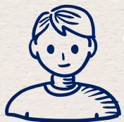
公職營養師及 地方政府說明