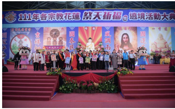
圖2 111年度各宗教花蓮祭天祈福暨遶境活動-開幕(小巨蛋)活動