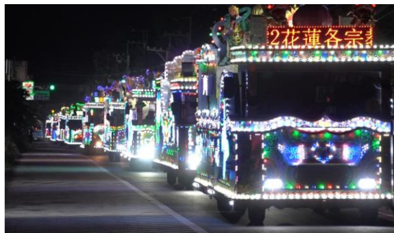
圖3 111年度各宗教花蓮祭天祈福暨遶境活動-傳統藝閣花車