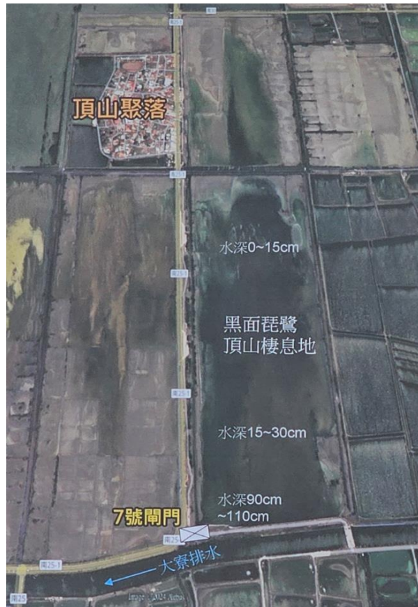
圖2 黑面琵鷺頂山棲息地與大寮排水相對位置圖

(六)有關上述黑面琵鷺熱區頂山地區之水門管理，雖自105年以來即有因水源不足導致當地風砂過大、棲地品質不良等現象，然迄今仍以防汛原則操作（僅排水、不引水）等情，本院詢據台江國家公園管理處表示：「目前水門管理權責單位仍為臺南市政府水利局主政，且協調地方對於水閘門放水管理之歧見涉及因素眾多，雖然防汛與候鳥棲息期間不同，仍需要藉由各方溝通及行動體現，方可逐步建立互信。台江國家公園管理處刻正辦理台江國家公園計畫第2次通盤檢討，透過先將濕地納入台江國家公園範圍，管理處方可投入經費及資源俾利水位調控，以及辦理生態復育、社區培力及推動生態旅遊等，取得地方對濕地明智利用認同後，推動濕地保