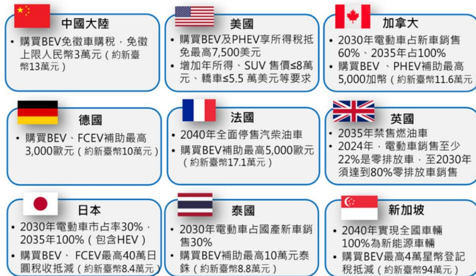
圖4、2024年主要國家新售電動車之購車補助

圖2 2014~2023年全球電動車銷售量與市售比統計 4 ，其中2023年市售比為15.8%，銷售量達1,418萬輛（BEV銷售998萬輛、PHEV銷售420萬輛），較2022年增加336萬輛，成長率達35%