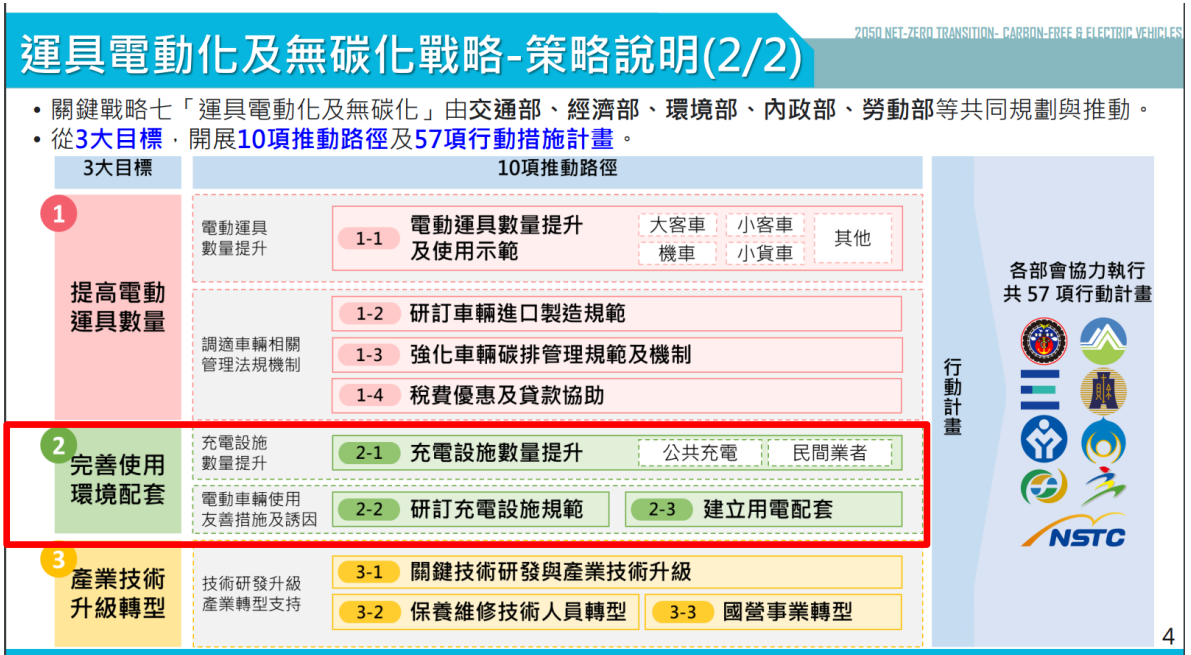
圖5 3大目標/完善使用環境配套/充電設施數量提升、電動車輛使用友善措施及誘因