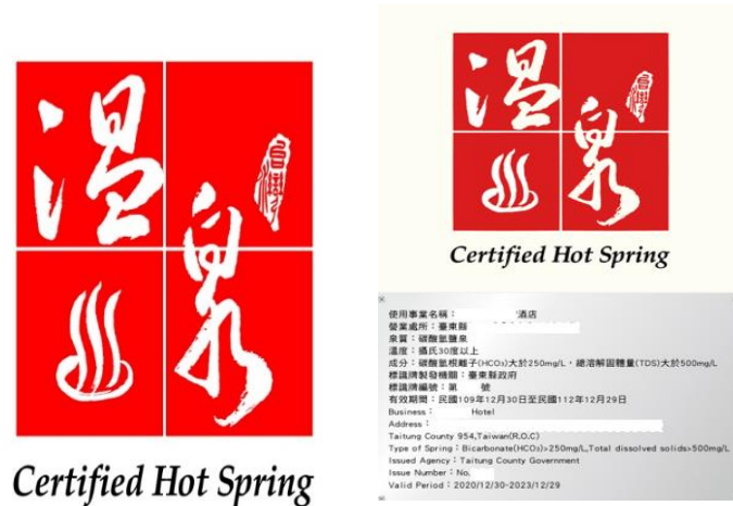
圖1 溫泉標章（左）與溫泉標章標識牌（右）之型式

使用事業若未依溫泉法第 18 條之規定取得溫泉標章而營業者，由直轄市、縣（市）觀光主管機關處 1 萬元以上 5 萬元以下罰鍰，並得按次連續處罰，合先敘明。