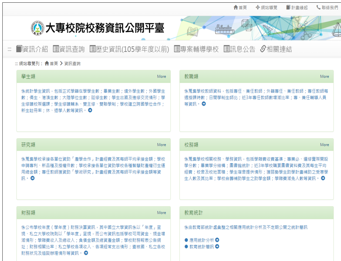
圖1 教育部大專校院校務資訊公開平臺