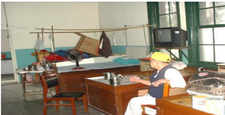
圖 2003年拍攝蓬萊舍內裝照片（無隔間）

(三)本案後經樂生院民自救會及愛地芽協會等相關團體反映，樂生療養院院方涉違反上位計畫，擅將蓬萊舍由內部無隔間樣式（如下圖），改建為3間住宅套房，企圖打壓院民集會活動，剝奪院民及相關公民團體合法使用蓬萊舍之權益，切斷院民與社會的連結等語。