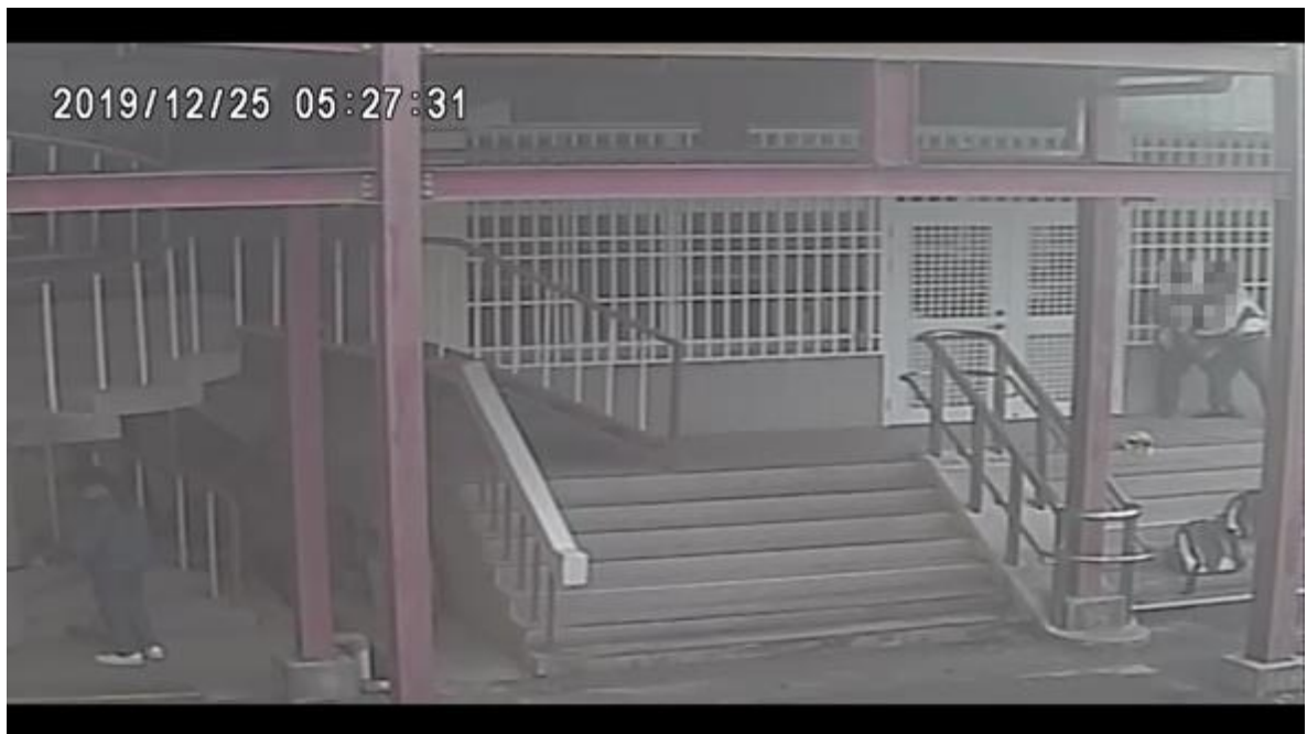
圖3 甲師試圖壓制A生

(七)因嘉義市政府及大業國中未能及時釐清事發經過，導致校園衝突事件處理過程逾2年，使A生處於不友善之校園環境，亦顯示教育部就類案之監督及處理密度不足，影響學生受教權及身心健康。本院111年8月18日詢據A生家長表示：