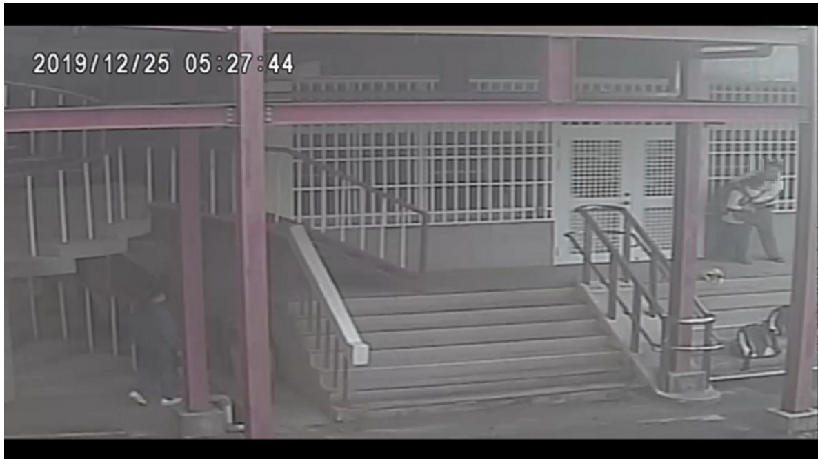
圖2 甲師拉扯A生頸部並控制其行動