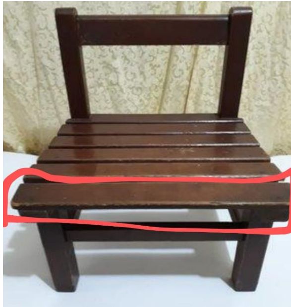
圖5 甲師疑似體學生罰使用之椅板。