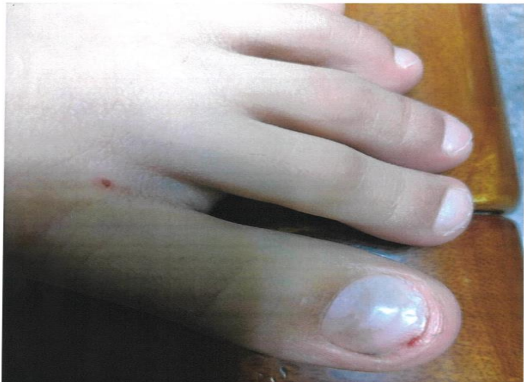
圖4 戊生〔姐〕遭胡師傷到右腳之診斷證明