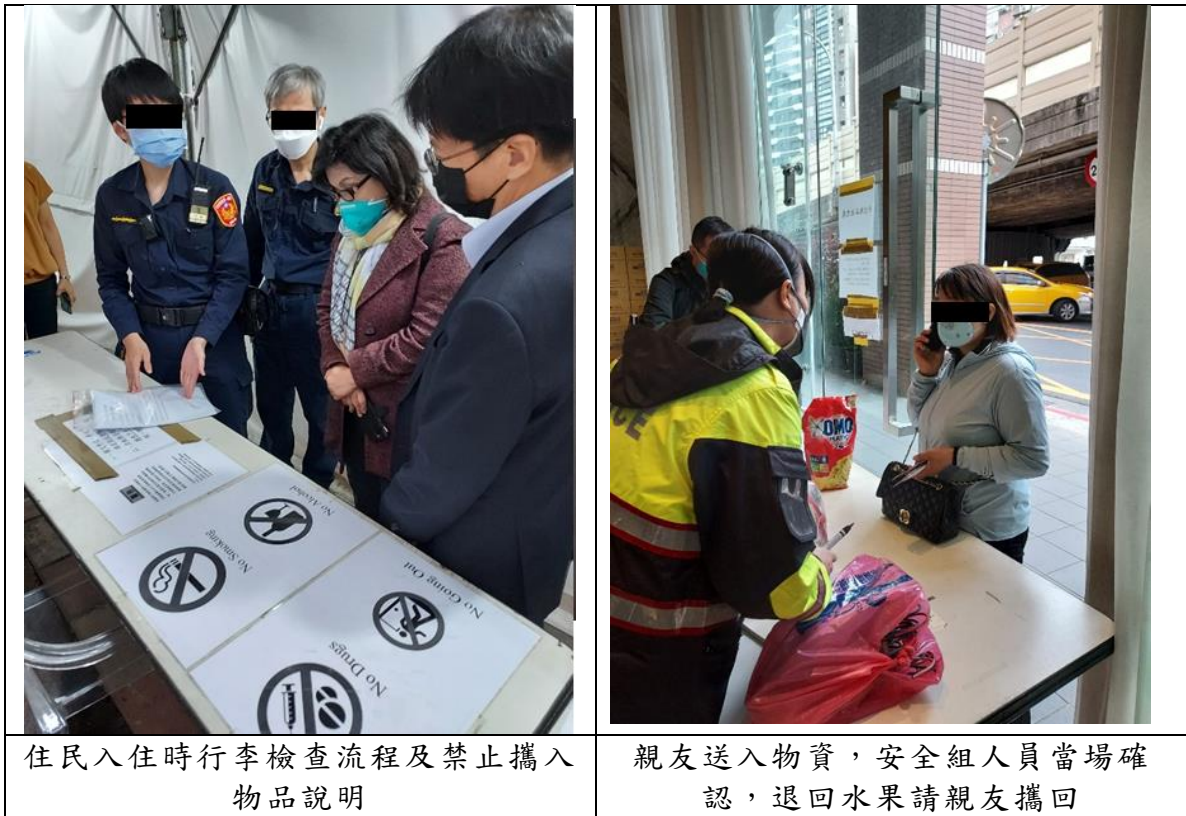
住民入住時行李檢查流程及禁止攜入物品說明