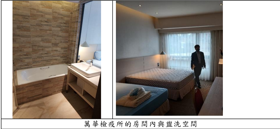
萬華檢疫所的房間內與盥洗空間