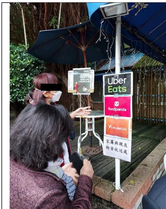
安心檢疫所可以代收外送平台、家屬與親友送入物資