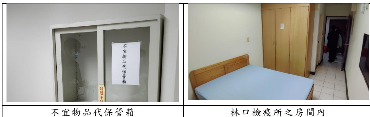
照片1 中央徵用林口檢疫所