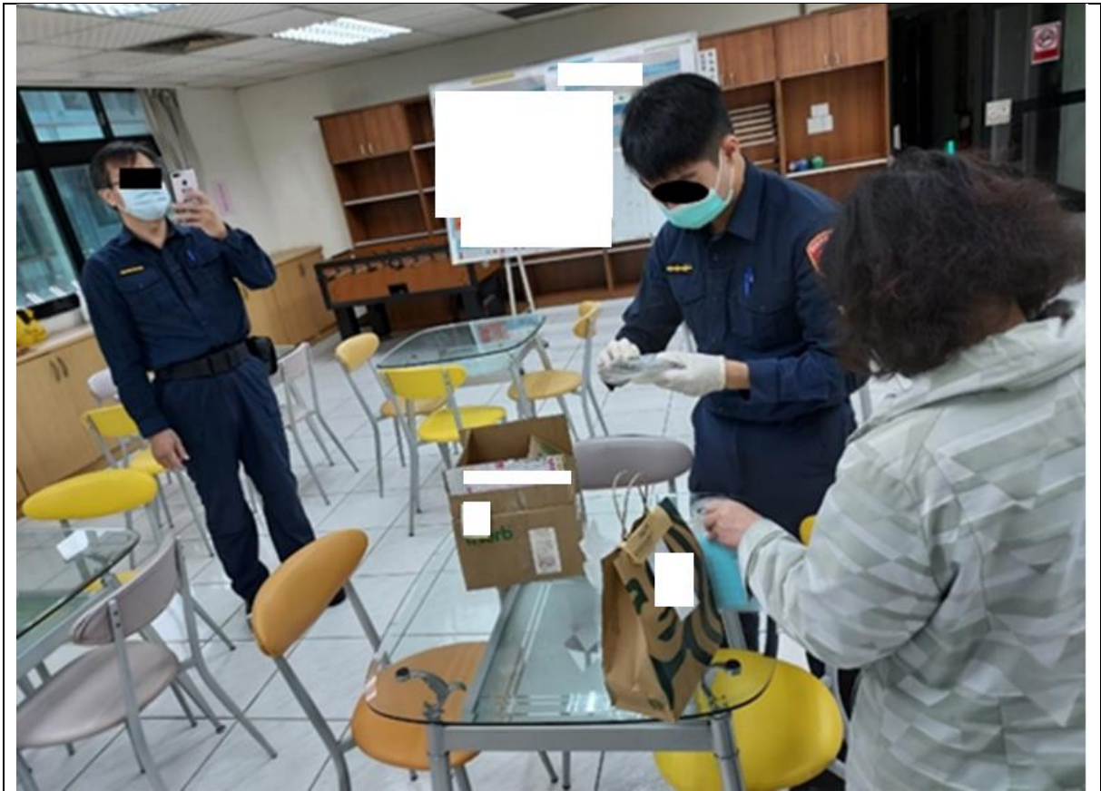
照片2 林口檢疫所對送入物資進行安全檢查