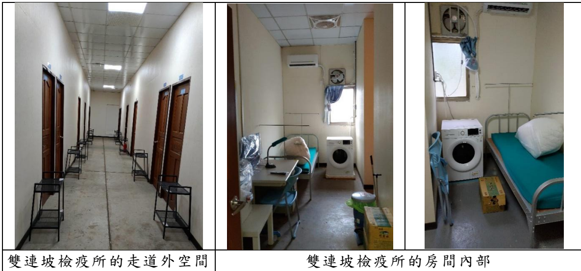
雙連坡檢疫所的走道外空間

寬鬆」、「我們這裡沒有查過毒品那類的違禁品，慢性病的藥物那種可以，其他種類的藥品要問醫生，我們這裡有視訊看診，可以提供藥物」。