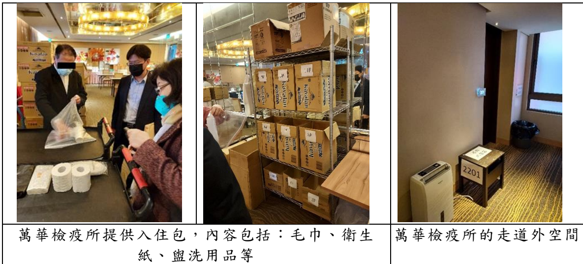
萬華檢疫所提供入住包，內容包括：毛巾、衛生紙、盥洗用品等