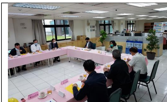
調查委員與林口檢疫所人員座談

1、林口檢疫所是我國首批集中檢疫所之一，自109年1月31日啟用，首批入住者即是同年2月3日抵臺的第一批武漢包機乘客。林口檢疫所亦承接移工專案、境外留學生專案，及桃園或鄰近縣市大型群聚專案等，總計林口檢疫所共收住7,736人 49 。