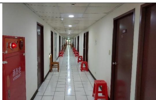
林口檢疫所之房間外走道