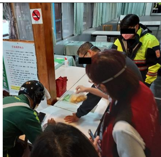
親友送入物資會請親友填寫相關資料，當場確認送入物資內容，目視檢查無異常，即隨餐送入