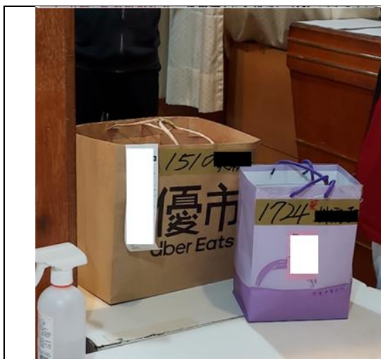
外送平臺物資經目視判斷外觀完整即不另拆封檢查

4、本案履勘時適逢有外送平臺及住民親友親送物資到所，安全組與後勤組人員依正常作業流程實施安全檢查。