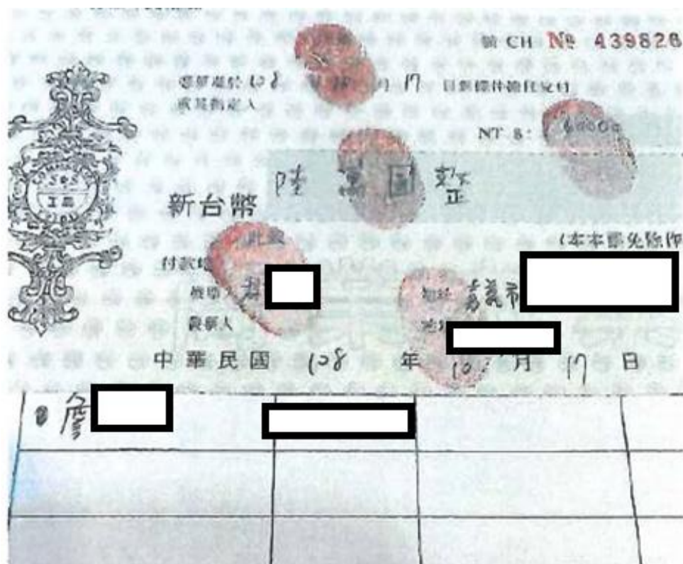
圖 林男之母謝○○提供被害人林男遭詹○○、黃○○逼迫所簽署之本票相片供警方查證。