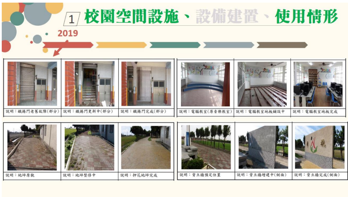
圖2 潭墘國小裝修校園空間設施之情形