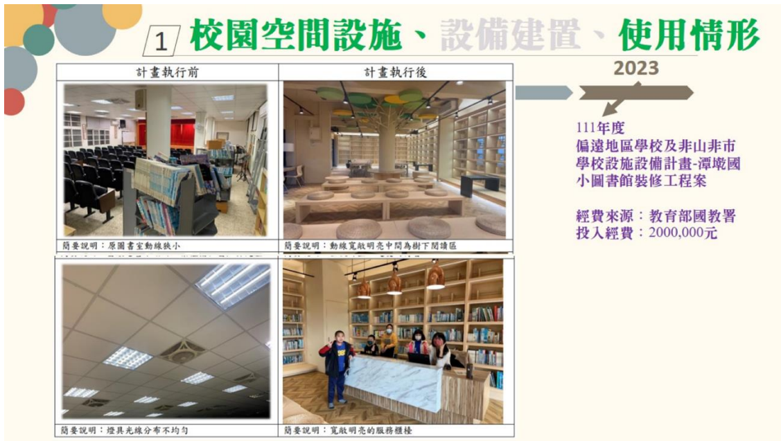
圖3 潭墘國小裝修圖書館之情形